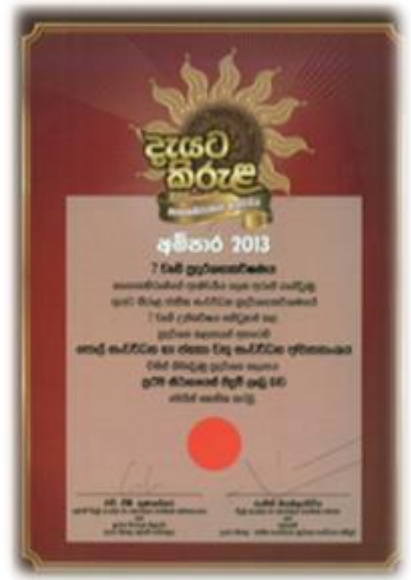
8.1 நாட்டின் மகுடம் 2013 முதலாமிடத்திற்குரிய விருதை அதிமேதகு சனாதிபதியிடமிருந்து பெற்றுக் கொள்ளல்