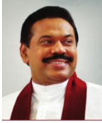
அதிமேதகு சனாதிபதி மஹிந்த ராஜபக்ஷ