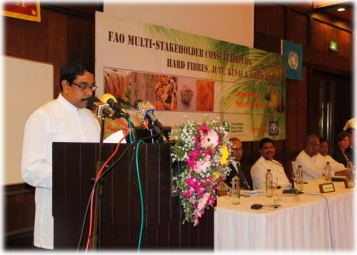
8.4 கௌரவ அமைச்சர் அங்குரார்ப்பண அமர்வில் உரையாற்றுகையில்