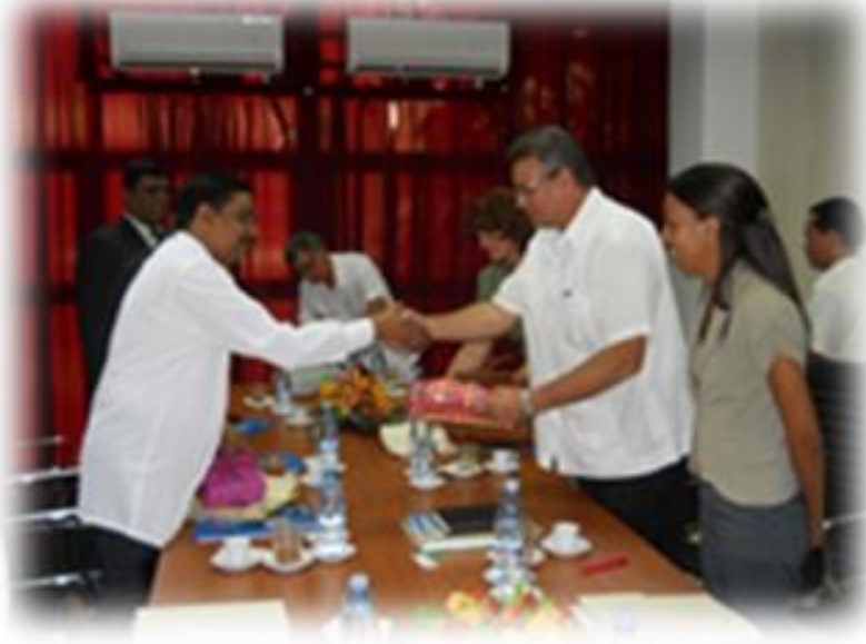
8.10 கௌரவ அமைச்சர் கியூபா நாட்டின் கௌரவ விவசாய அமைச்சரை சந்தித்தபோது

அதிமேதகு சனாதிபதி அவர்கள் 2012 ஆம் ஆண்டில் கியூபாவில் மேற்கொண்ட விஜயத்தின் போது ஏற்படுத்திக் கொள்ளப்பட்ட இருபக்க புரிந்துணர்வு உடன்படிக்கையின் கீழ், தெங்குத் துறையின் அபிவிருத்தி தொடர்பான இணக்கப்பாட்டை மீளாய்வு செய்வதற்காக, தெங்கு அபிவிருத்தி மற்றும் மக்கள் தோட்ட அபிவிருத்தி அமைச்சர் உள்ளிட்ட தூதுக்குழுவின் 2013 யூன் மாதம் கியூபாவிற்கான விஜயமொன்றை மேற்கொண்டனர். இதன்போது தெங்குத் துறையின் அபிவிருத்திக்கான தொழிநுட்பப் பரிமாற்றங்கள் மற்றும் பயிற்சிகள் தொடர்பாக இரு தரப்பிரனரிடையேயும் இணக்கப்பாடுகள் எட்டப்பட்டன.