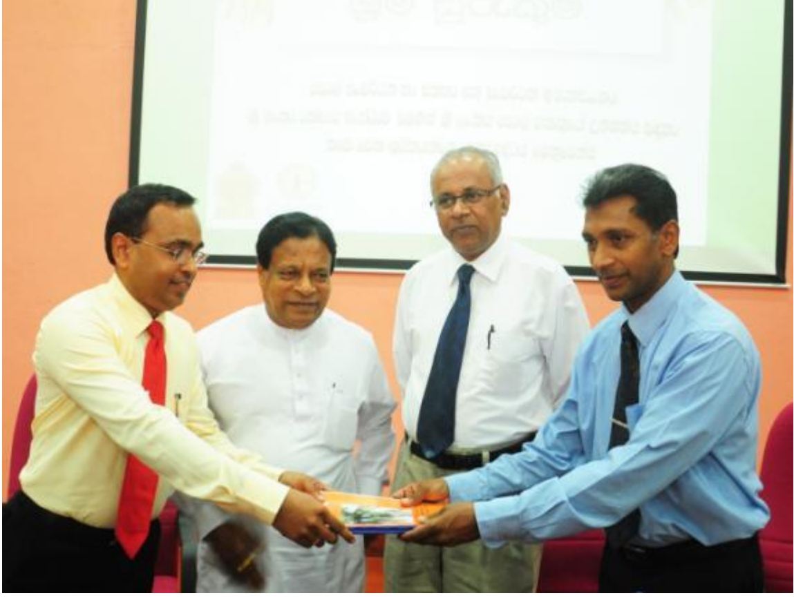
9.3 கப்றுக ஊழியப் பாதுகாப்பு நிகழ்ச்சித் திட்டத்தின் அங்குரார்ப்பண வைபவத்தின் போது

தெங்குப் பயிர்ச் செய்கை மற்றும் கைத்தொழிந்துறையில் தொழில் புரிகின்ற ஆயிரக்கணக்கான தொழிலாளர்களின் உயிராபத்து, அவர்கள் நோய்வாய்ப்படும் சந்தர்ப்பங்களில் எதிர்நோக்க வேண்டி வருகின்ற நிதிக்கட்டுப்பாடு மற்றும் இத்தொழிலுக்குரிய குறைந்த மட்டத்திலான சமூக அங்கீகாரம் என்பவற்றைக்கருத்திலெடுத்து இந்நிலைமைகளை இல்லாதொழிப்பதற்காக ஆரம்பிக்கப்பட்ட ஒரு புதிய நிகழ்ச்சித் திட்டமே கப்றுக ஊழியப் பாதுகாப்பு நிகழ்ச்சித்திட்டமாகும். தெங்குத் தொழிலில் ஈடுபட்டுள்ள தொழிலாளர்களை மையமாகக் கொண்டு செயல்படுத்தப்படுகின்ற இந்நிகழ்ச்சித் திட்டம் இலங்கைக் காப்புறுதிக் கூட்டுத்தாபனத்தோடு ஏற்படுத்திக் கொண்ட ஒரு புரிந்துணர்வு ஒப்பந்தத்திற்கமைய அமூல் செய்யப்படுகின்றது.