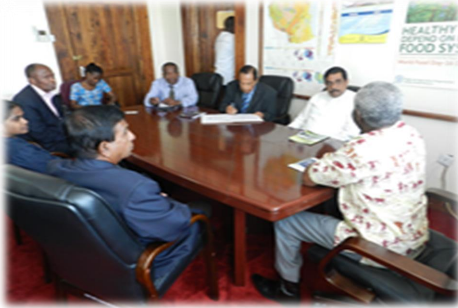
8.12 கௌரவ அமைச்சர் தன்சானியாவின் அரசாங்கத்தின் அலுவலர்களுடனான கலந்துரையாடல் ஒன்றில்

அதிமேதகு சனாதிபதி அவர்கள் 2013 ஆம் ஆண்டு யூன் மாதத்தில் தன்சானியாவில் மேற்கொண்ட விஜயத்தின் போது, ஏற்படுத்திக் கொண்ட இருபக்க புரிந்துணர்வு உடன்படிக்கையின் கீழ் தெங்குத் துறையின் அபிவிருத்தி தொடர்பான இணக்கப்பாடுகளை மீளாய்வு செய்வதற்காக தெங்கு அபிவிருத்தி மற்றும் மக்கள் தோட்ட அபிவிருத்தி அமைச்சர் உள்ளிட்ட தூதுக்குழுவொன்று 2013 ஆம் ஆண்டு ஒக்டோபர் மாதத்தில் விஜயமொன்றை தன்சானியாவிற்கு மேற்கொண்டது. அப்போது தன்சானியாவின் நோய்கள், கிருமிகளின் தொல்லை என்பவற்றை ஒழிப்பதற்காக இலங்கையின் அறிவை பரிமாறிக்கொள்ள இணக்கம் காணப்பட்டது.