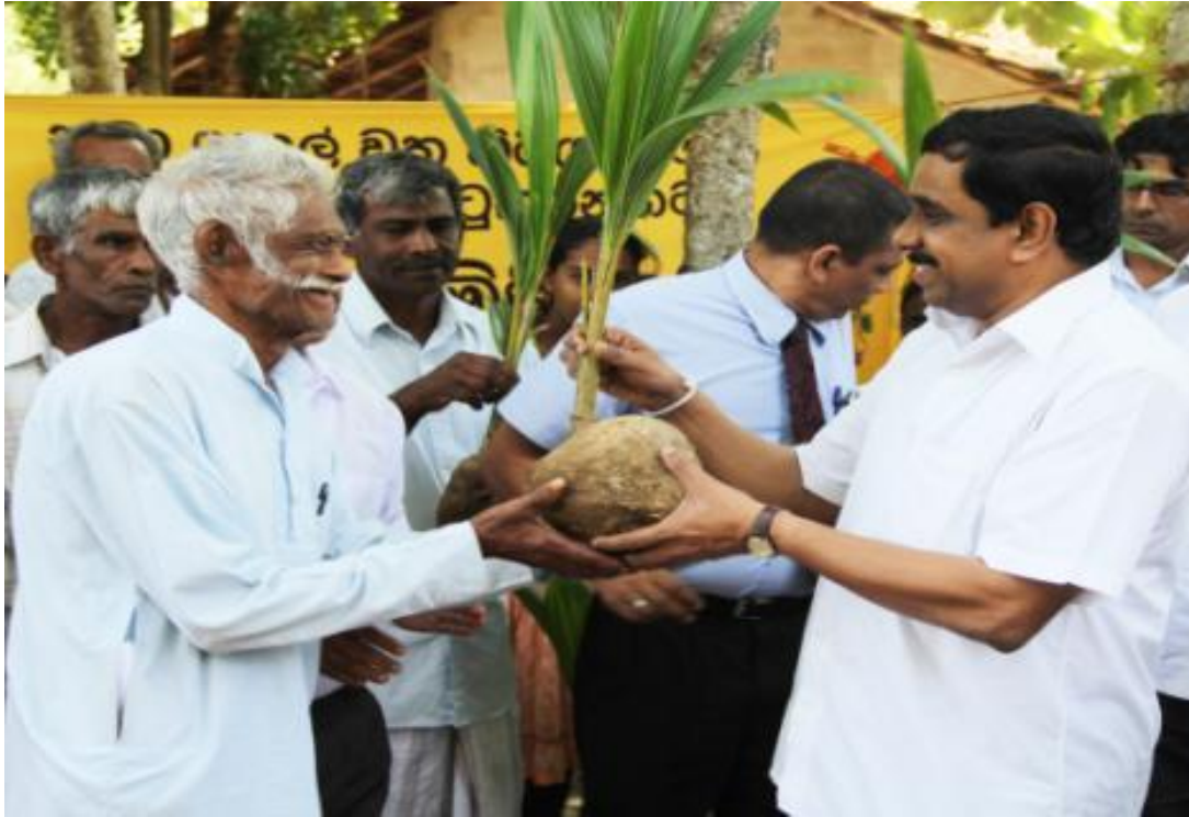
8.9கப்பூக நிகழ்ச்சித் திட்டத்தின் கீழ் கௌரவ அமைச்சரினால் தென்னங் கன்றுகள் பகிர்த்தளிக்கப்படும் போது