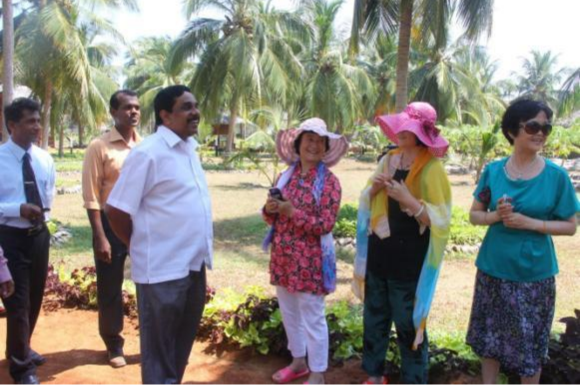
9.6 பாசிக்குடா தெங்குக் கலாச்சார பூங்காவின் கண்காணிப்புச் சுற்றுலாவொன்றில் கலந்து கொண்ட கௌரவ அமைச்சர் வெளிநாட்டவர்களுடன்