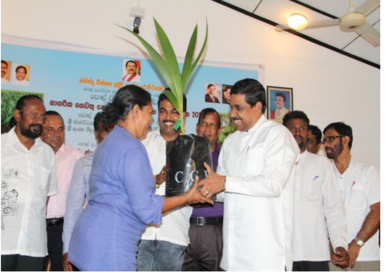
9.1 நகரப்புற தெங்குப் பயிர்ச் செய்கை நிகழ்ச்சித் திட்டத்தை ஆரம்பித்து வைத்து கௌரவ அமைச்சர் தென்னங் கன்றொன்றை வழங்கி வைக்கும் சந்தர்ப்பமொன்றில்

நகர வீடமைப்புத் திட்டங்களில் வாழ்கின்ற நகரவாசிகளுக்கு தத்தம் அன்றாட நுகர்விற்கான தேங்காய்களை கொள்வனவு செய்ய வேண்டிய கட்டாய நிலை காணப்படுகின்றது. அவர்களுக்குச் சொந்தமான வரையறுக்கப்பட்ட காணித்துண்டை சிறந்த முறையில் பயன்படுத்தி பொருளாதார ரீதியாக வலுவூட்டுவதை இலக்காக்கொண்டு புதிய கலப்பினத் தெங்கு இனமொன்று நகரப்புற வீடமைப்புத்திட்டங்களுக்காக அறிமுகப்படுத்தப்பட்டது ஒரு வீட்டிற்கு இரண்டு கலப்பின தென்னங்கன்கள் வீதம் வழங்கப்படுகின்றன. இவை 04 ஆண்டு காலத்திற்குள் காய்க்கக் கூடியமையாக விளங்குகின்றமையாலும் மிக உயரமாக வளராத ஒரு விசேட இனத்தாவரமாதலாலும் நகரப்புற மக்களுக்கு மிக எளிதாக தேங்காய்களைப் பெற்றுக் கொள்ளக்கூடிய ஒரு புது அனுபவம் வாய்க்கப் பெறுகின்றது.