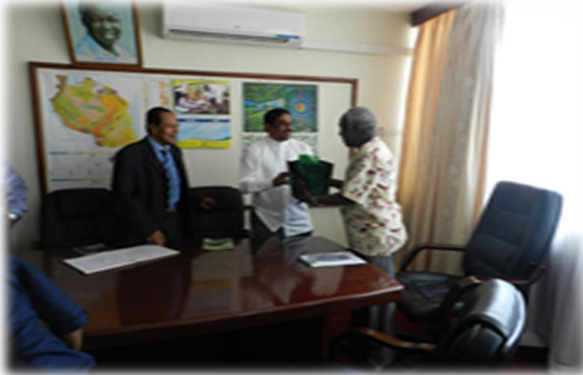
8.13 கௌரவ அமைச்சர் தன்சானியாவின் அரசாங்க அலுவலர்களுடன் நினைவுச் சின்னங்களைப்பரிமாறிக் கொண்ட போது