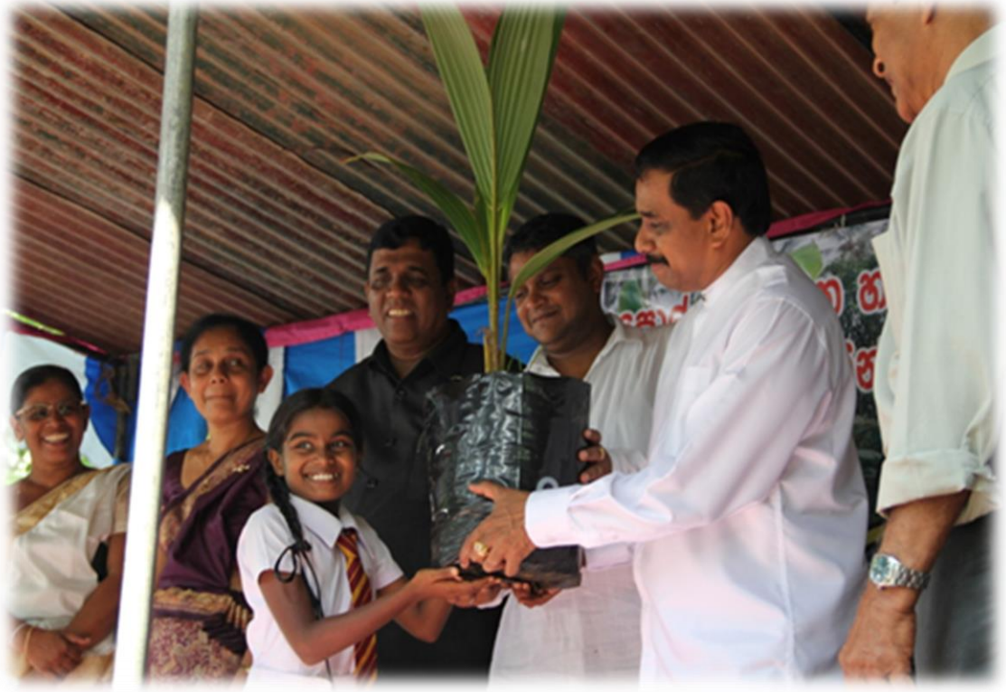
10.2கப்பறுகய் சிப்நெனய் நிகழ்ச்சித் திட்டத்தின் கீழ் கௌரவ அமைச்சர் 6 ஆம் ஆண்டு மாணவியொருவருக்கு தென்னங் கன்றுகளைப் பகிர்ந்தளிக்கும் போது

பாடசாலை மாணவர்களின் பங்களிப்போடு மேற்கொள்ளப்படுகின்ற இந்நிகழ்ச்சித் திட்டம் ஆசிய, பசுபிக் தெங்குச் சமூக சர்வதேசக் கருத்தரங்கில் பெரிதும் மெச்சப்பட்டது. 2013 ஆம் ஆண்டின் இறுதியில் இந்நிகழ்ச்சித் திட்டத்தின் கீழ் 173,721 பாடசாலை மாணவர்களுக்கு 341,407 தென்னங்கன்றுகள் விநியோகிக்கப்பட்டுள்ளன.