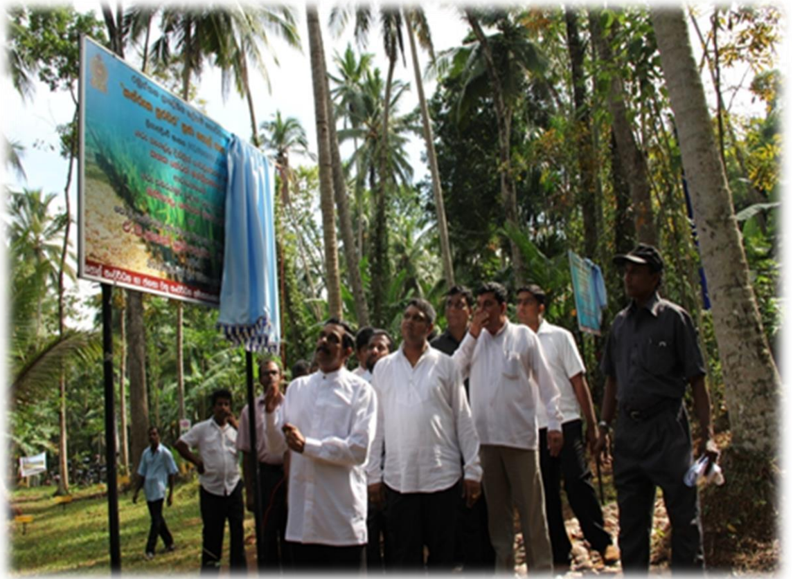
10.1 கௌரவ அமைச்சர் கப்றுக புறவர ஒன்றை அங்குரார்ப்பணம் செய்கின்ற சந்தர்ப்பம்

கப்றுக நிதியச் சட்டத்தின் கீழ் இந்நிகழ்ச்சித் திட்டம் அமுல்செய்யப்படுவதோடு, 2016 ஆம் ஆண்டளவில் நாட்டின் அனைத்து மாவட்டங்களினதும் 180 பிரதேச செயலகப் பிரிவுகளை அளவியவாறு இது நடைமுறைப்படுத்த திட்டமிடப்பட்டுள்ளது. கப்றுக புறவர நிகழ்ச்சித் திட்டத்தின் கீழ் 2013 ஆம் ஆண்டிற்குள் இதுவரை 2491 ஆரம்பச் சங்கங்களும் 129 வலயச் சங்கங்களும் நிறுவப்பட்டுள்ளன.