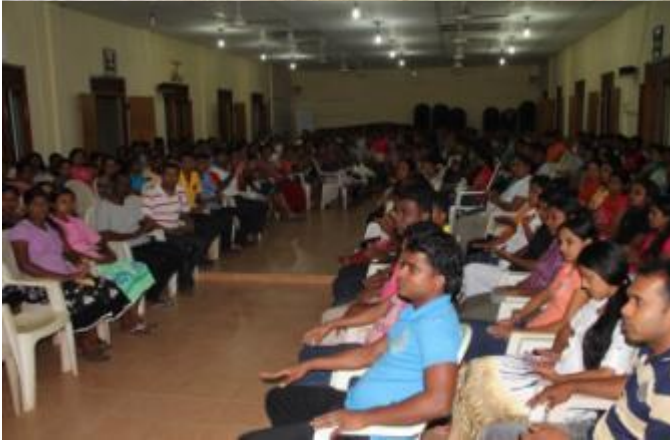
8.8 பட்டதாரிகளின் பயிற்சியின் போது ஒரு சந்தர்ப்பம்