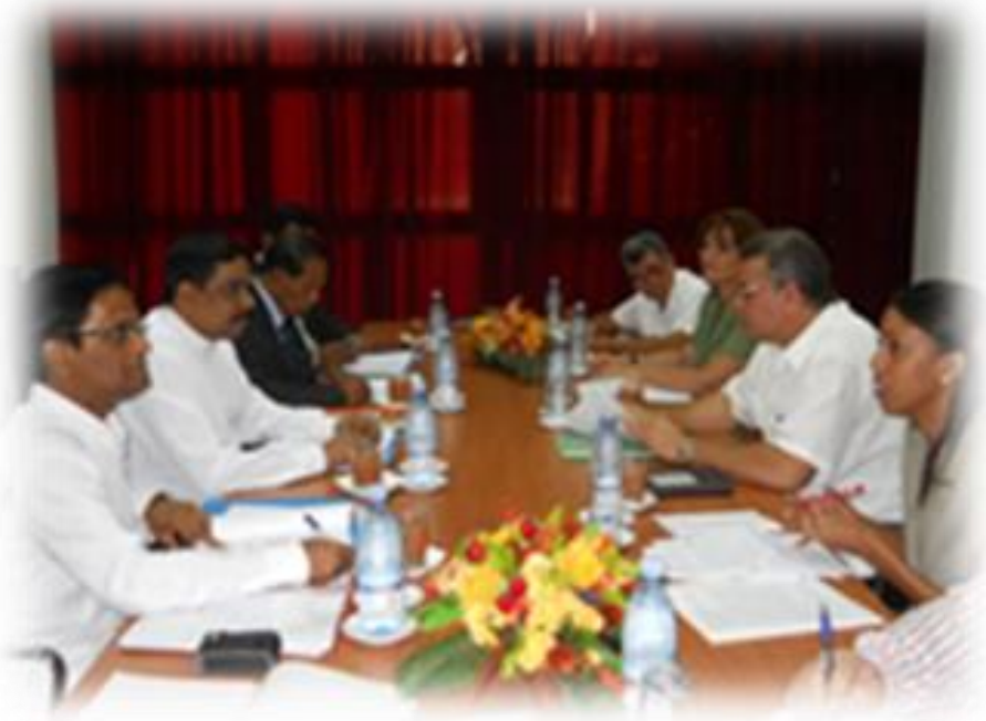
8.11 கௌரவ அமைச்சர் கியூபா நாட்டின் அரசாங்க அலுவலர்களிடான கலந்துரையாடல் ஒன்றில்