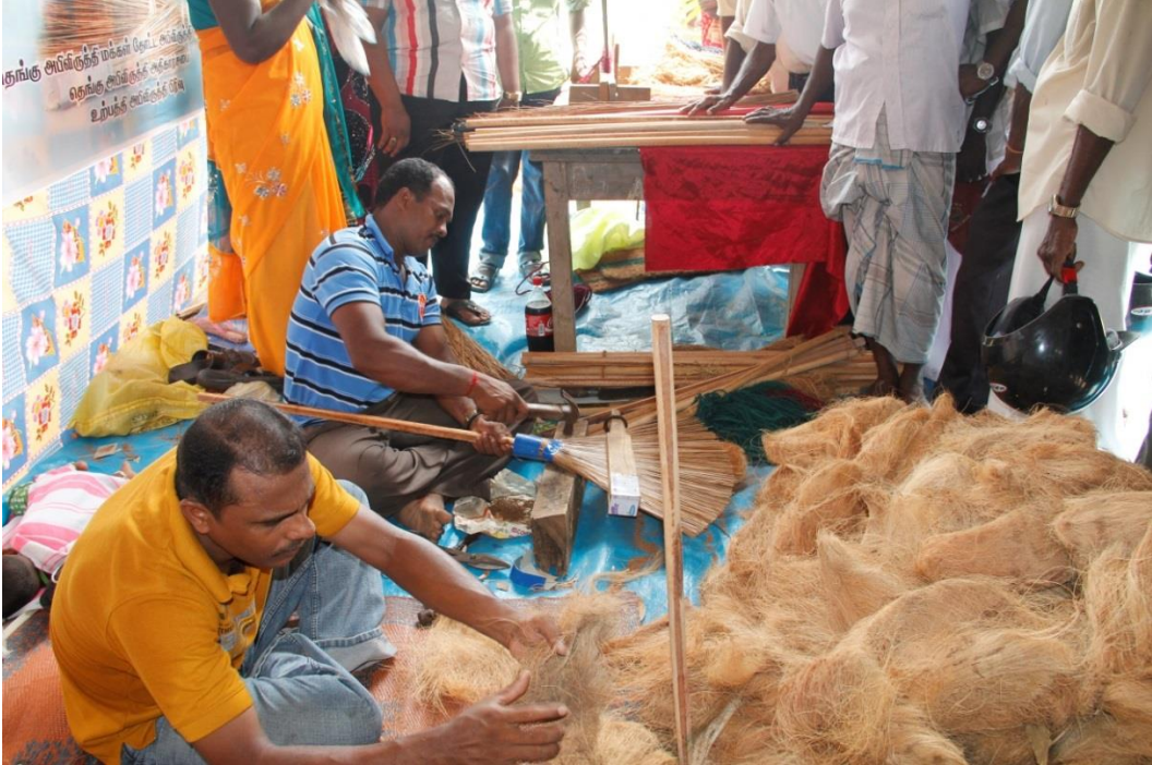
10.4 தெங்குசார் உற்பத்தி நிகழ்ச்சித் திட்டமொன்றின் போது

கிராமிய மட்டத்தில் சாதாரணமாக வீசி எறியப்படுகின்ற தெங்குசார் பொருட்களைப் பயன்படுத்தி குடிசைக் கைத்தொழில்களை நிறுவுவதற்காக ஒவ்வொரு பிரதேசத்திலும் பாரம்பரியமாக மேற்கொள்ளப்பட்டு வருகின்ற தெங்குசார் கைத்தொழில்களுக்காக புதிய தொழிநுட்பங்களை அறிமுகப்படுத்தல், தெங்குசார் கைப்பணிப் பொருட்கள் அலங்காரப் பொருட்கள் என்பவற்றை உற்பத்தி செய்தல் போன்வற்றிற்கான பிரயோக ரீதியான பயிற்சி நிகழ்ச்சித் திட்டங்கள், கருத்தரங்குகள் மற்றும் விழிப்பூட்டல் நிகழ்ச்சித் திட்டங்கள் என்பவற்றை நடாத்தல் ஆகியன அமுல் செய்யப்பட்டன. மேலும் அவ்வற்பத்திகளுக்கான சந்தை அறிமுகஞ் செய்தல், சந்தைக்கான உற்பத்தி, கேள்வி தொடர்பான விழிப்பூட்டல் என்பனவும் மேற்கொள்ளப்பட்டன. 2013.12.31 ஆம் திகதியன்று 32 பிரதேச செயலாளர் பிரிவுகளுக்குள் தெங்குசார் குடிசைக் கைத்தொழில்களை மேற்கொள்வதற்காக 73 பயிற்சி நிகழ்ச்சித் திட்டங்கள் நடாத்தப்பட்டுள்ளதோடு, அவற்றினூடாக பயன்பெற்றுள்ள பயனுக்கரிகளின் எண்ணிக்கை ஏறத்தாழ 2017 ஆகும்.