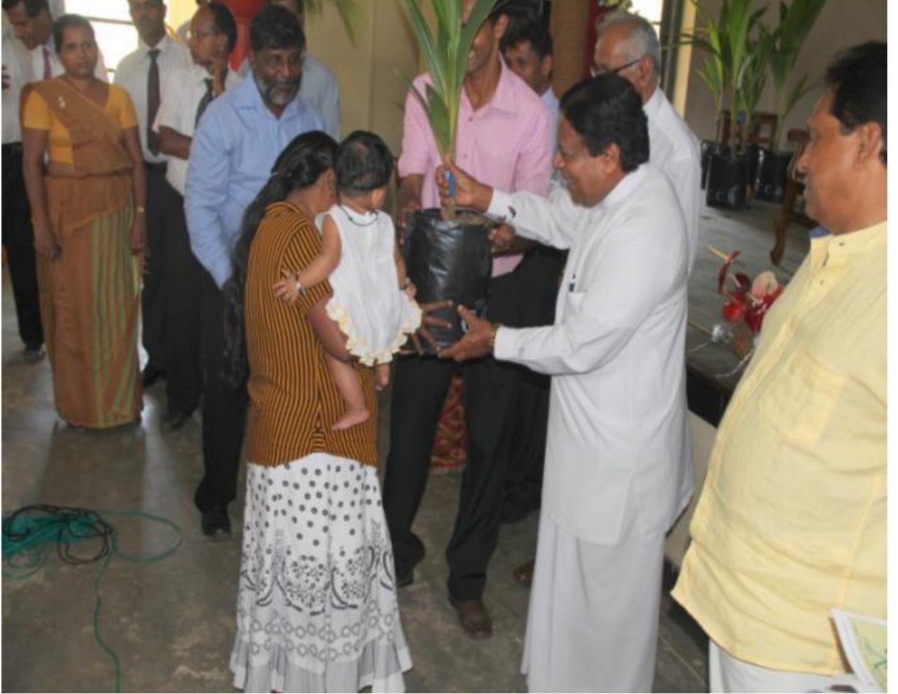
9.2கப்றுகய் பரப்புறய் நிகழ்ச்சித் திட்டத்தின் அங்குரார்ப்பணத்தின் போது கௌரவ பிரதி அமைச்சர் தாயொருவருக்கு தென்னங் கன்றொன்றை வழங்கி வைக்கும் சந்தர்ப்பம்