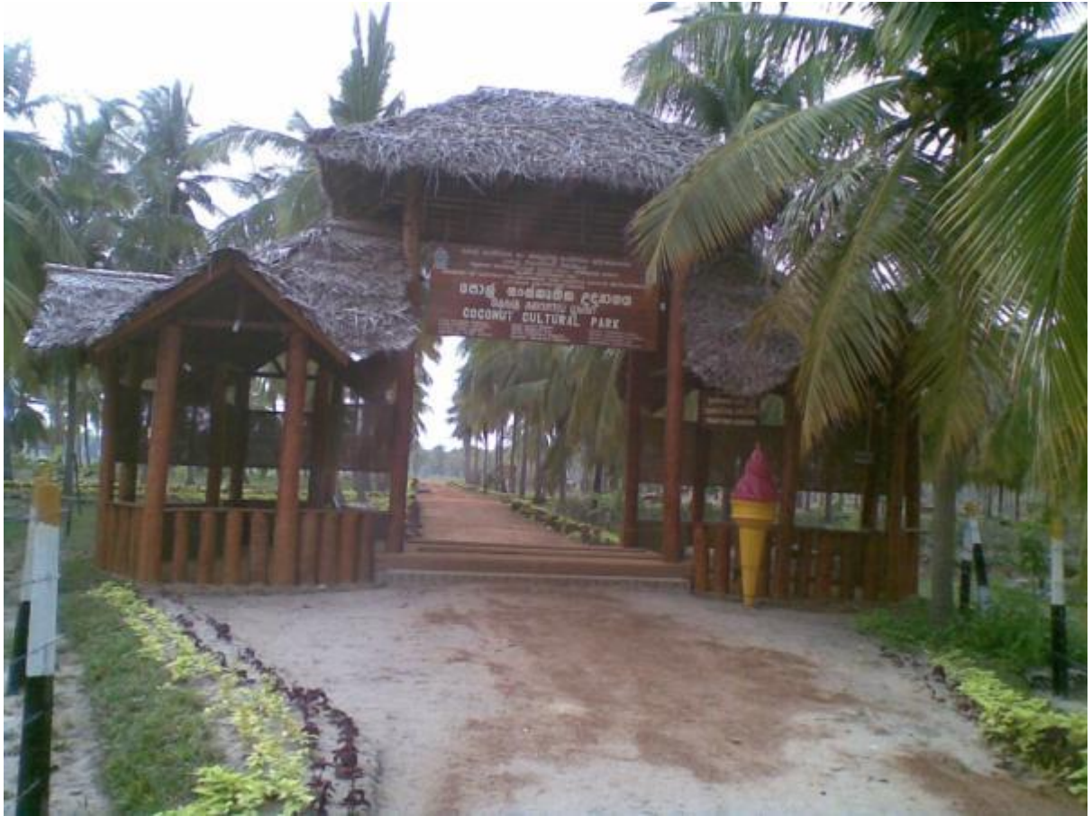
9.5 பாசிக்குடா தெங்குக் கலாச்சார பூங்காவின் நுழைவாயில்

மூன்று தசாப்த பயங்கரவாதம் முடிவிற்குக் கொண்டுவரப்பட்டவுடன் இலங்கையைச் சுற்றுலாவிடாக ஒரு சுவர்க்க பூமியாக மாற்றக்கூடிய சாத்தியப்பாட்டை இனங்கண்டு, இத்தேசிய பொறுப்பாண்மைக்கு ஓர் உந்து சக்தியாக கௌரவ அமைச்சரின் கொள்கைத் திட்டத்திற்கமைய தெங்குக் கலாச்சார மற்றும் சுற்றுலா ஊக்குவிப்பு நிகழ்ச்சித் திட்டம் ஆரம்பிக்கப்பட்டது. இதன் கீழ் நிருமாணிக்கப்பட்டுவருகின்ற பாசிக்குடா தெங்குக் கலாச்சாரப் பூங்காவில் தெங்கு மற்றும் தெங்குசார்கைத்தொழில்களைக் காட்சிப்படுத்தி வெளிநாட்டு சுற்றுலாப் பயணிகளை அறிவூட்டவும் கவர்ந்தீர்க்கவும் எதிர்பார்க்கப்படுகின்றது. அதேபோல இதற்காக இப்பிரதேசத்தில் காணப்படுகின்ற தெங்கு மற்றும் தெங்குசார் மூலப்பொருட்களின் பிரயோகத்தை ஊக்குவித்து அப்பிரதேசத்திற்குள்ளேயே கைத்தொழிலாளர்களை உருவாக்கவும் அவர்களுக்கு உதவிகளை வழங்குவதனுடாக தேசியப் பொருளாதாரத்திற்கு வலுவூட்டவும் திட்டமிடப்பட்டுள்ளது.