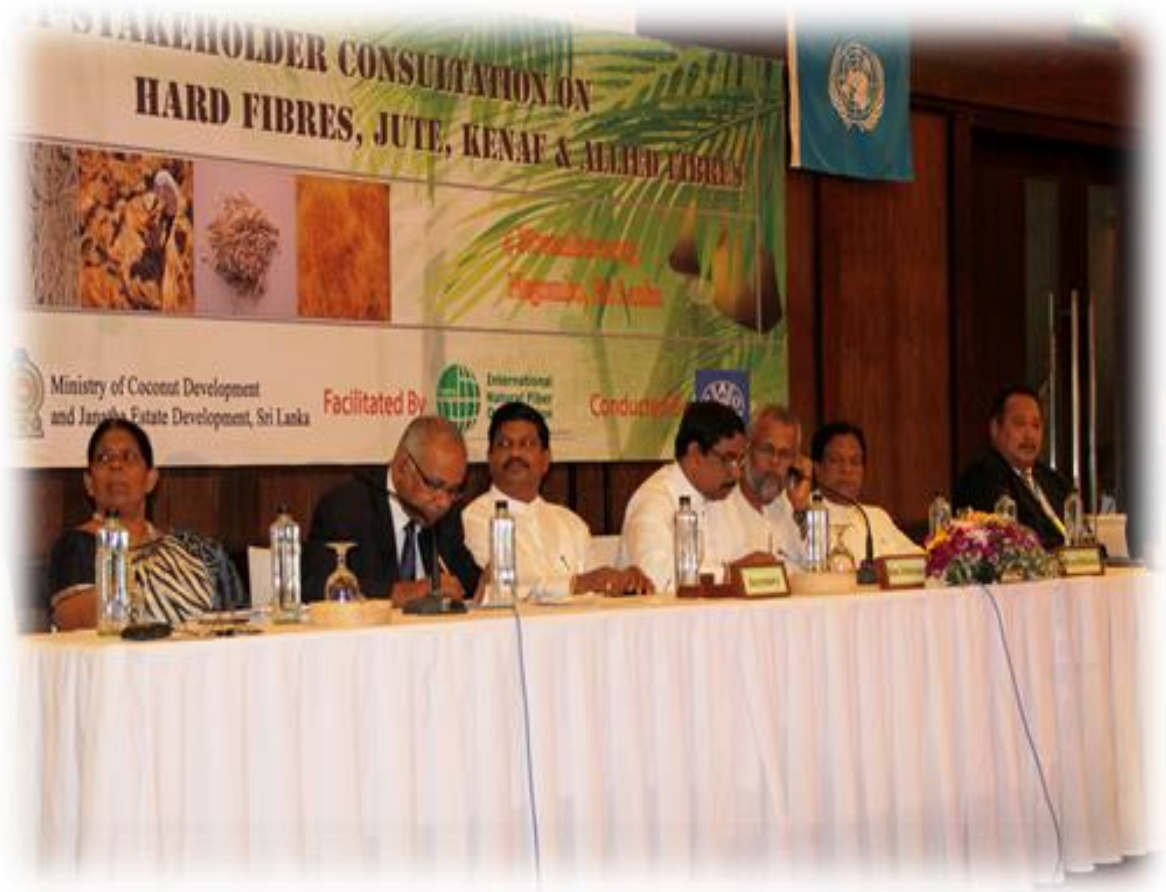
8.3 சர்வதேச நார்கள் கருத்தரங்கின் அங்குரார்ப்பண அமர்வு

அதில் அடுத்த இரண்டு ஆண்டுகளுக்காக இந்த சர்வதேச அமைப்பின் தலைமைத்துவம் இலங்கைக்கு உரித்தானது.