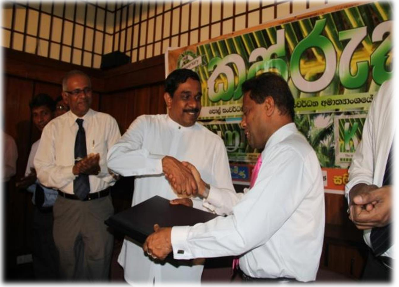
8.7 கப்பறுக செய்திப் பத்திரிகையின் முதலாம் ஆண்டினை நினைவு கூர்ந்து

தெங்குசார் சமூகத்திற்கு கருத்திட்டங்கள் மற்றும் கைத்தொழில் தகவல்கள் போன்றே இத்துறையின் புதிய போக்குகள் தொடர்பான தகவல்களை வழங்கி தெங்குசார் சமூகம் மற்றும் அமைச்சுக்கிடையே தொடர்பாடல் ஊடகமொன்றாக அமைச்சின் உத்தியோகபூர்வ பத்திரிகையான “கப்பறுக” செய்திப் பத்திரிகை 2012 ஒக்தோபர் மாதம் முதல் தொடர்ச்சியாக “தினமின” “தினகரன்” மற்றும் “டெய்லி நிவுஸ்” செய்திப் பத்திரிகைகளோடு ஒவ்வொரு மாதமும் இரண்டாம் வெள்ளிக் கிழமை பிரசுரிக்கப்பட்டு வருகின்றது.