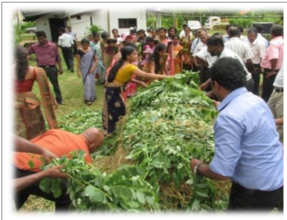
9.4 කාබනික පොහොර නිෂ්පාදනය හා කාබනික පොහොර යෙදීම ප්‍රවලිත කිරීම පිළිබඳ පුහුණු වැඩසටහනක අවස්ථාවක්

9.4 පොල් වගාව සඳහා කාබනික පොහොර නිෂ්පාදනය හා කාබනික පොහොර යෙදීම ප්‍රවලිත කිරීමේ හා දිරිගැන්වීමේ වැඩසටහන