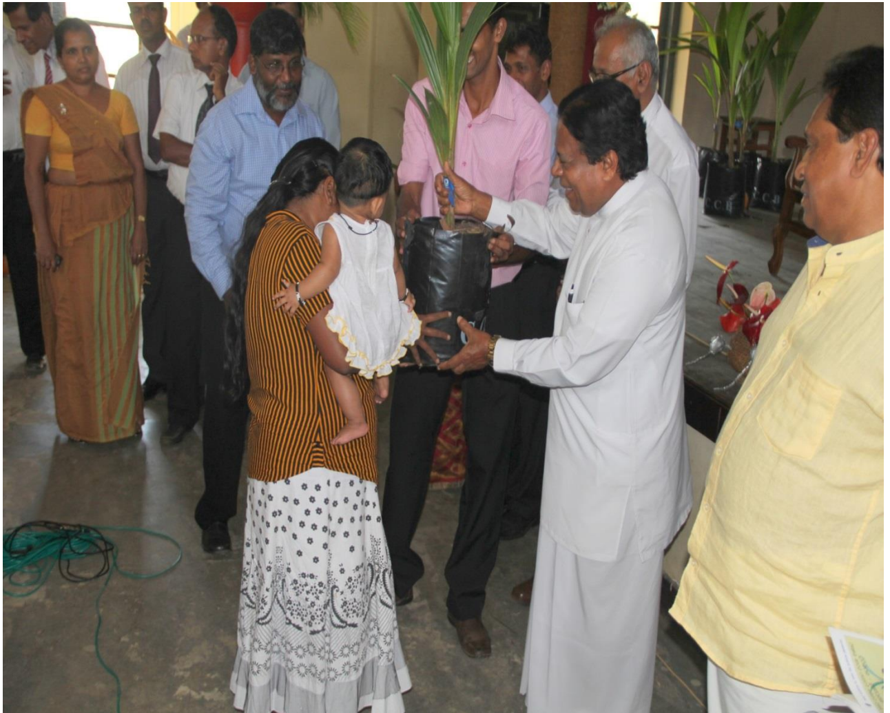
9.2 කප්පරුකයි පරපුරයි වැඩසටහන ආරම්භයේදී ගරු නියෝජ්‍ය අමාත්‍යතුමා මවකට පොල් පැළයක් ලබාදීමේ අවස්ථාවක්

තුරුලතා ශාඛ හා පරිසරය මිනිසාගේ ජීවිතය හා අවියෝජනීය ලෙස බැඳී ඇත. උපත ලබන සෑම මිනිසෙක්ම පරිසරය සුරැකීමේ වගකීමට උරදී සිටී. ඒ අර්ථයෙන් උපත ලබන සෑම දරුවෙකුටම තම ළමාකාලය සමග බඳ්ඨව වැඩෙන ලෙස පොල් පැළ දෙකක් ලබා දීමෙන් පොල් පැළය හා එයට සමගාමීව පරිසරය කෙරෙහි ඇළුම් කරන මිනිසෙකු නිර්මාණය කළ හැකිය. පොල් ගස එළඳරණ වයස අවු.5 දී දරුවා පාසලට ඇතුළුවන විට එහි අස්වැන්න ඔහුගේ අධ්‍යාපනය හා අනාගතය තීරණය බවට දායක වෙයි. එය ළමයා සමග වැඩේ. එනමින් පොල් ගස පරපුරක උරුමයකි.