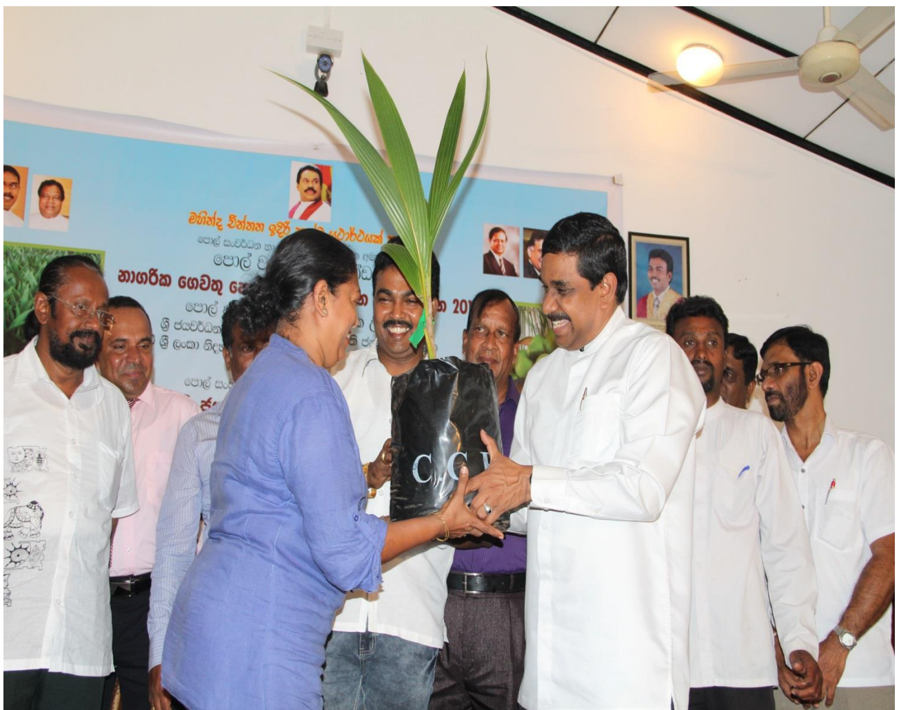
9.1 නාගරික පොල් වගා වැඩසටහන ආරම්භ කරමින් ගරු අමාත්‍යතුමා විසින් පොල් පැළයක් ලබාදීමේ අවස්ථාවක්

නාගරික නිවාස යෝජනාක්‍රමවල ජීවත්වන නගරවාසීන්ට ස්වකීය පරිභෝජනය සඳහා අනිවාර්යයෙන්ම පොල් මිලට ගැනීමට සිදුවේ. ඔවුන් සතු සීමිත බිම් කොටස ප්‍රශස්ත ලෙස උපයෝජනය කරමින් ආර්ථික වශයෙන් සවියක් ලබාදීමද අරමුණු කරමින් නව දෙමුහුන් පොල් ප්‍රභේදයක් නාගරික නිවාස යෝජනා ක්‍රමයක් සඳහා හඳුන්වා දෙනු ලැබීය. එක් නිවසකට