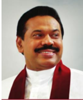
අතිගරු ජනාධිපති මහින්ද රාජපක්ෂ මැතිතුමා