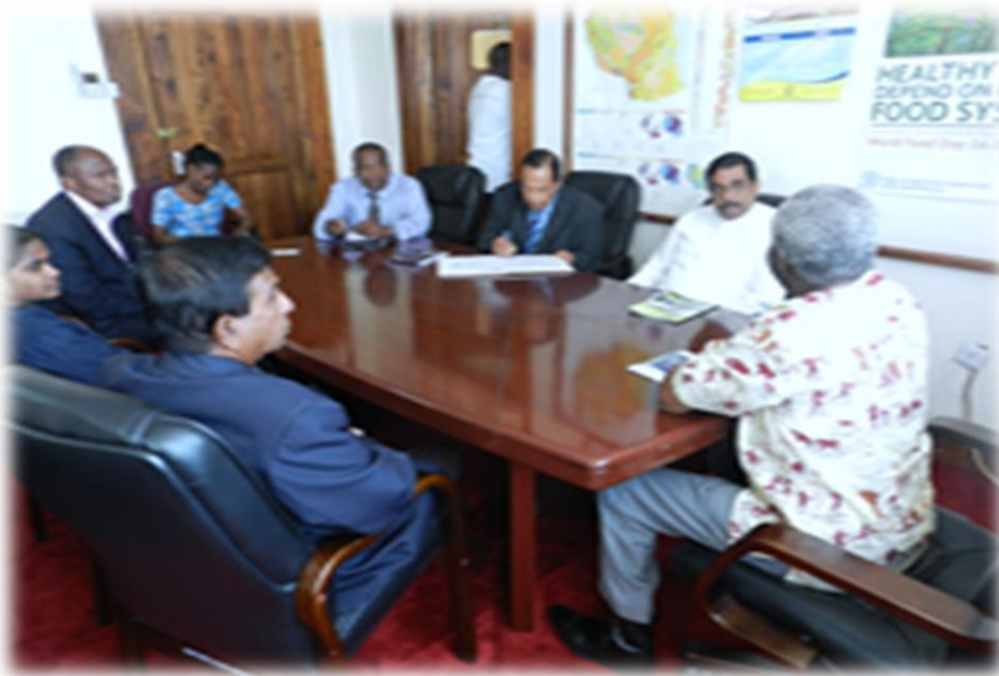
8.12 ගරු ඇමතිතුමා ටැන්සානියානු රාජ්‍ය නිලධාරීන් සමඟ සාකච්ඡාවක

අතිගරුජනාධිපතිතුමන් 2013 ජුනි මාසයේදී ටැන්සානියාවේ සිදු කළ සංචාරයේදී ඇති කරගත් ද්වි පාර්ශ්වික අවබෝධතා ගිවිසුම යටතේ පොල් කේෂ්ත්‍රයේ සංවර්ධනය පිළිබඳව එකඟතා සමාලෝචනය කිරීම සඳහා පොල් සංවර්ධන හා ජනතා වතු සංවර්ධන අමාත්‍යතුමා ඇතුළු දූත පිරිසක් 2013 ඔක්තෝබර් මාසයේදී සංචාරය කරනු ලැබීය. මෙහිදී ටැන්සානියාවේ රෝග හා කෘමි උවදුර මර්ධනය සඳහා ශ්‍රී ලංකාවෙන් දැනුම ලබා දීමට එකඟතාවයන්ට එළඹෙන ලදී.