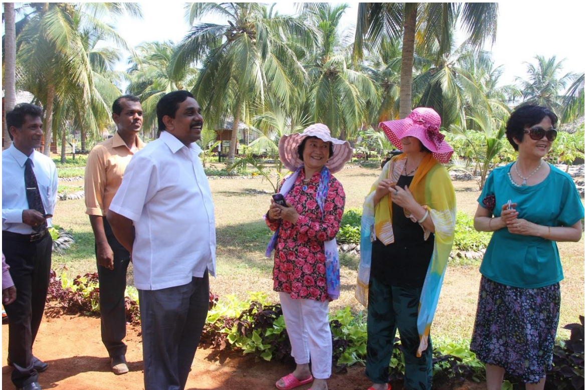
9.6 පායිකුඩා පොල් සංස්කෘතික උද්‍යානයේ නිරීක්ෂණ වාරිකාවක් සඳහා සහභාගි වූ ගරු ඇමතිතුමා විදේශිකයින් පිරිසක් සමඟ