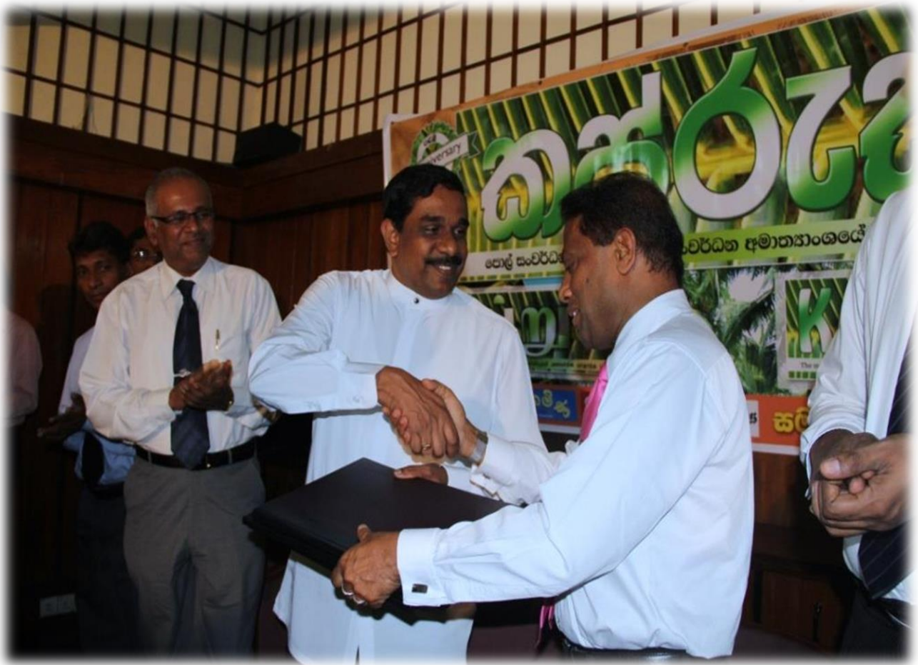
8.7 කජරුක පුවත්පතෙහි පළමු සංවත්සරය සමරමින්

පොල් ප්‍රජාව වෙත ව්‍යාප්ති හා කර්මාන්ත තොරතුරු මෙන්ම ක්ෂේත්‍රයේ නව ප්‍රවණතා පිළිබඳ තොරතුරු ලබාදෙමින් පොල් ප්‍රජාව හා අමාත්‍යාංශය අතර සන්නිවේදන මාධ්‍යක් ලෙස අමාත්‍යාංශයේ නිල පුවත්පත වන “කජරුක” පුවත්පත 2012 ඔක්තෝබර් මස සිට අඛණ්ඩව දිනමිණ , තිණකරන් හා ඩේලි නිවුස් පුවත්පත් සමඟ සෑම මසකම දෙවන සිකුරාදා දින ප්‍රකාශනයට පත් කරනු ලැබීය.