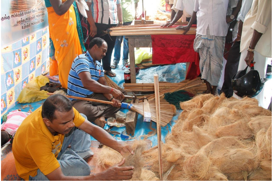
10.4 පොල් ආශ්‍රිත නිෂ්පාදන වැඩසටහනක අවස්ථාවක්