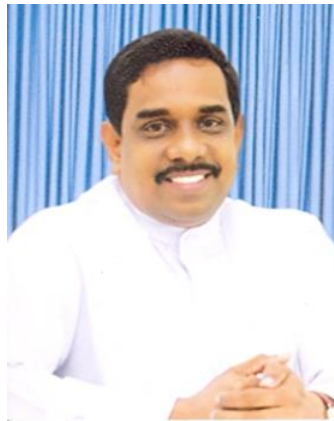
ඒ.පී. ජගත් පුෂ්පකුමාර මැතිතුමා පොල් සංවර්ධන හා ජනතා වතු සංවර්ධන ගරු අමාත්‍යතුමා