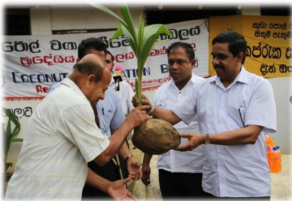
8.9 කප්රුක වැඩසටහන යටතේ ගරු ඇමතිතුමා විසින් පොල් පැළ බෙදා දෙමින්

පොල් වගා කිරීම හා සුළු හා මධ්‍ය පරිමාණ පොල් ආශ්‍රිත කර්මාන්ත වෙත ප්‍රජාව යොමු කිරීම සඳහා කුඩා ඉඩම් හිමියන් හා ප්‍රජා මූල සංවිධාන ලෙස ඔවුන් සංවිධාන ගත කර ඒ තුළින් පොල් ගස පාදක කරගත් රැකියා අවස්ථා උත්පාදනය කර දිළිඳුභාවය පිටු දැකීම අරමුණු කර ගනිමින් ආරම්භ කරන ලද “කප්රුක පුරවර ” වැඩසටහන යටතේ 2013-12-31 දින දක්වා කප්රුක පුරවර 133 ක්ද ප්‍රාථමික සමිති 5319 ක්ද ස්ථාපිත කර ඇත. මෙය 2016 දක්වා වන ඉලක්කයෙන් 73% ක් සහ 63% කි.