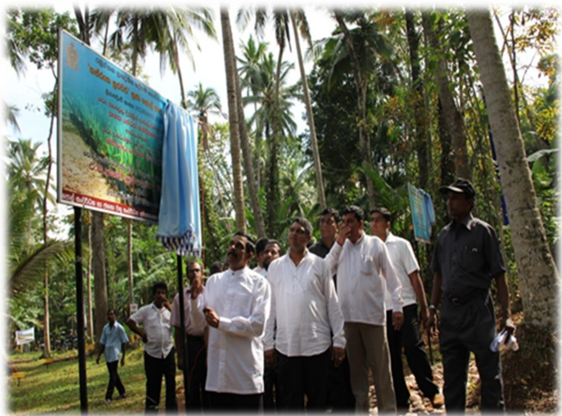
10.1 ගරු ඇමතිතුමා විසින් කජරුක පුරවරයක් ස්ථාපිත කිරීමේ අවස්ථාවක්

කජරුක අරමුදල් පනත යටතේ මෙම වැඩසටහන ක්‍රියාත්මක වන අතර 2016 වන විට දිවයිනේ පවතින සියළුම දිස්ත්‍රික්කවල ප්‍රාදේශීය ලේකම් කොට්ඨාශ 180 ක් ආවරණය කිරීමට සැලසුම් කර ඇත. කජරුක පුරවර වැඩසටහන යටතේ 2013 වර්ෂය තුළ මේ දක්වා ප්‍රාථමික සමිති 2669 ක්ද , කලාප සමිති 192 ක්ද පිහිටුවා ඇත.