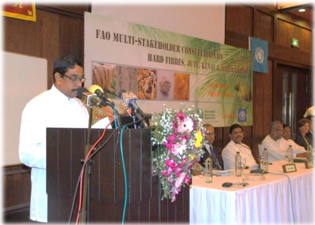
8.4 ගරු ඇමතිතුමා ආරම්භක සැසිය අමතමින්