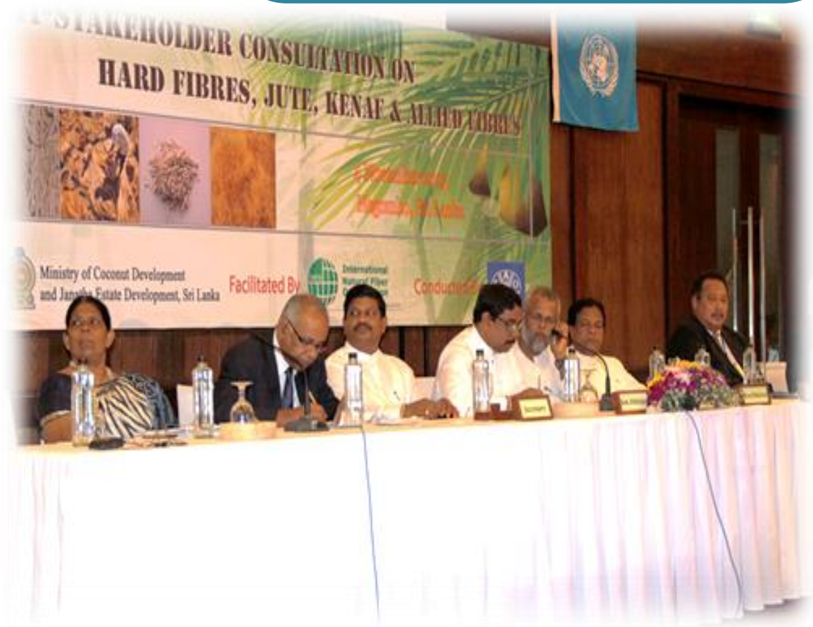
8.3 ජාත්‍යන්තර කෙඳි සමුළුවේ ආරම්භක සැසිය

එහිදී ඉදිරි වසර දෙකක කාලය සඳහා මෙම අන්තර්ජාතික සංවිධානයේ සභාපතිත්වය ශ්‍රී ලංකාවට හිමි විය.