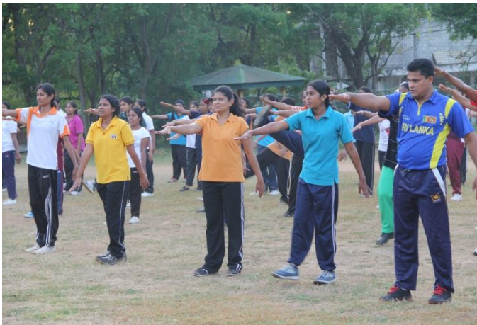
8.8 උපාධිධාරී පුහුණුවේ අවස්ථාවක්

රාජ්‍ය සේවයට එක්වූ නවක උපාධිධාරී අභ්‍යාසලාභීන්ගේ හා සංවර්ධන නිලධාරීන්ගේ ධාරිතා සංවර්ධනය අරමුණු කර ගනිමින් ගරු ඇමතිතුමාගේ සංකල්පයක් මත 250 ක කණ්ඩායමකට තේදින නේවාසික පුහුණු වැඩසටහනක් අමාත්‍යාංශයේ මෙහෙයවීමෙන් පැවැත්වීමට හැකි විය.