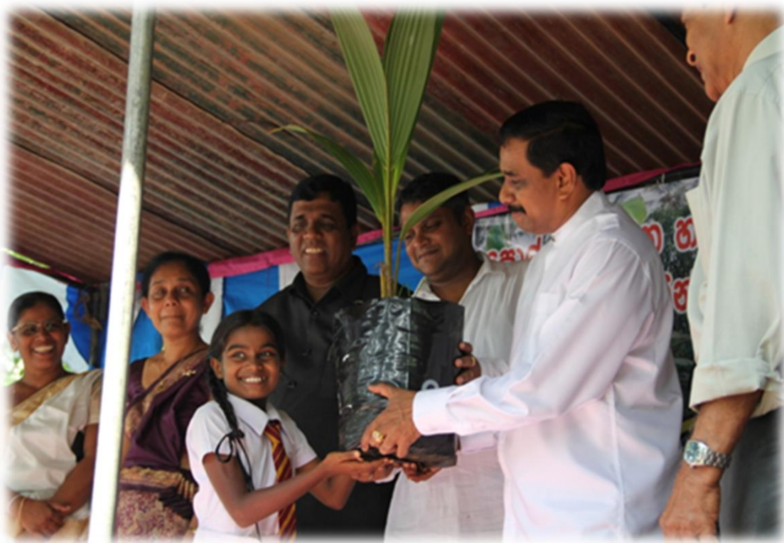
10.2 කප් රැකයි සිප්ණැනයි වැඩසටහන යටතේ ගරු අමාත්‍යතුමා විසින් 6 වසර ශිෂ්‍යාවකට පොල් පැළ බෙදා දෙමින්

පාසල් ළමුන් දායක කර ගෙන ක්‍රියාත්මක කරනු ලබන මෙම වැඩසටහන ආසියානු පැසිපික් පොල් ප්‍රජා ජාත්‍යන්තර සමුළුවේ දී විශේෂ ඇගයීමකටද ලක්විය. 2013 වර්ෂය අවසන් වන විට මෙම වැඩසටහන යටතේ පාසල් සිසුන් 173,721 කට පොල් පැළ 341,407 නිකුත් කිරීම සිදු කර ඇත.