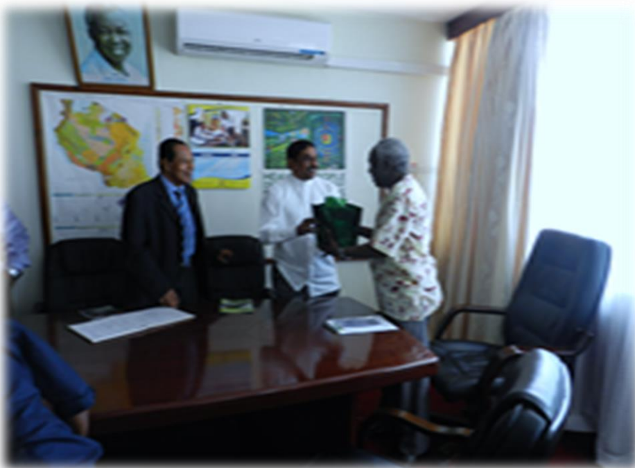
8.13 ගරු ඇමතිතුමා ටැන්සානියා රාජ්‍ය නිලධාරීන් සමඟ සිහිවටන හුවමාරු කර ගනිමින්