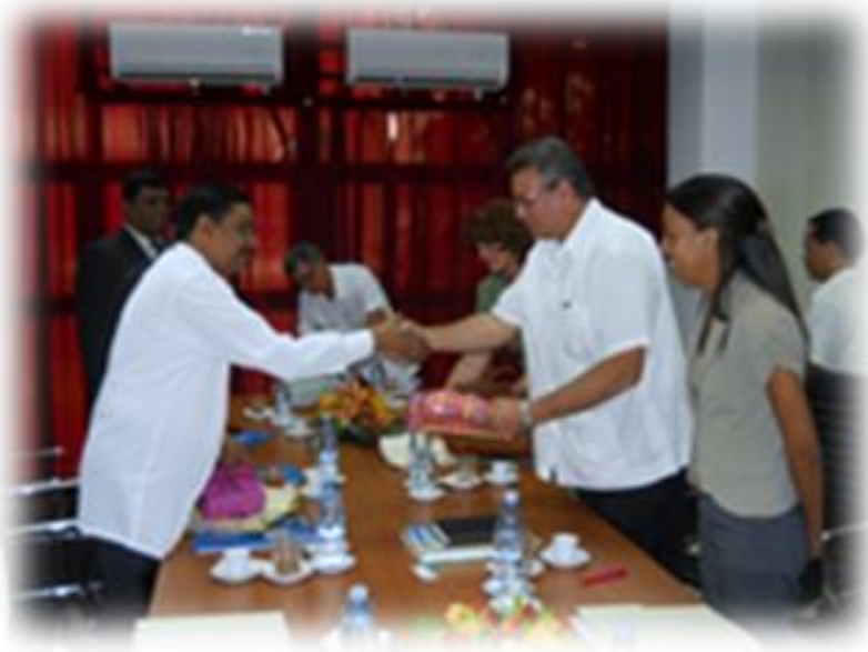
8.10 ගරු ඇමතිතුමා කියුබානු රාජ්‍යයේ ගරු කෘෂිකර්ම ඇමතිතුමා හමුවීම

අතිගරු ජනාධිපතිතුමන් 2012 වර්ෂයේදී කියුබාවේ සිදු කළ සංචාරයේදී ඇති කරගත් ද්විපාර්ශ්වික අවබෝධතා ගිවිසුම යටතේ පොල් කේන්ද්‍රයේ සංවර්ධනය පිළිබඳ වූ එකඟතා සමාලෝචනය කිරීම සඳහා පොල් සංවර්ධන හා ජනතා වතු සංවර්ධන අමාත්‍යතුමා ඇතුළු දූත පිරිසක් 2013 ජුනි මස සංචාරය කරනු ලැබීය. මෙහිදී පොල් කේන්ද්‍රයේ සංවර්ධනය සඳහා තාක්ෂණික හුවමාරුව හා පුහුණුවීම් සම්බන්ධව දෙපාර්ශ්වය අතර එකඟතාවයන් ඇති කර ගන්නා ලදී.