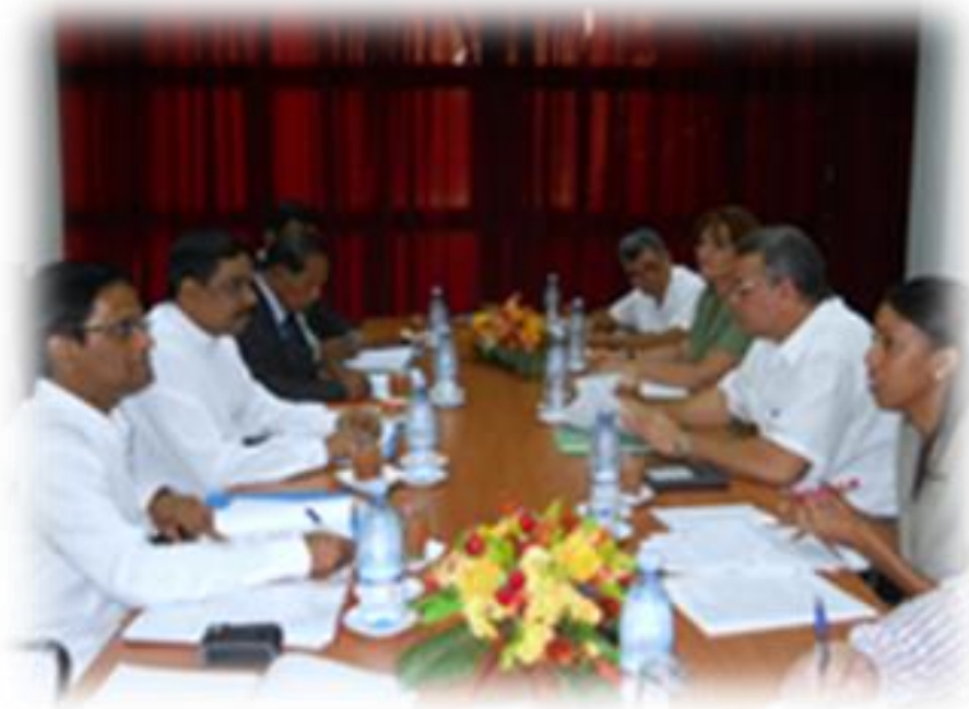
8.11 ගරු ඇමතිතුමා කියුබානු රාජ්‍යයේ නිලධාරීන් සමඟ සාකච්ඡාවක