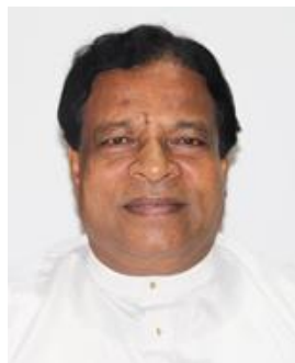
ඩී. ඇන්තනි වික්ටර් පෙරේරා මැතිතුමා පොල් සංවර්ධන හා ජනතා වතු සංවර්ධන ගරු නියෝජ්‍ය අමාත්‍යතුමා