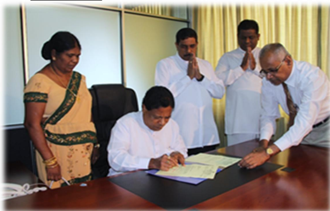
8.5 ගරු නියෝජ්‍ය අමාත්‍යතුමා වැඩ භාර ගැනීමේ අවස්ථාව

පුත්තලම් දිස්ත්‍රික් ගරු පාර්ලිමේන්තු මන්ත්‍රී බී. ඇන්තනි වික්ටර් පෙරේරා මැතිතුමා 2013.10.11 දින පොල් සංවර්ධන හා ජනතා වතු සංවර්ධන නියෝජ්‍ය අමාත්‍යවරයා ලෙස දිවුරුම් දෙනු ලැබීය.