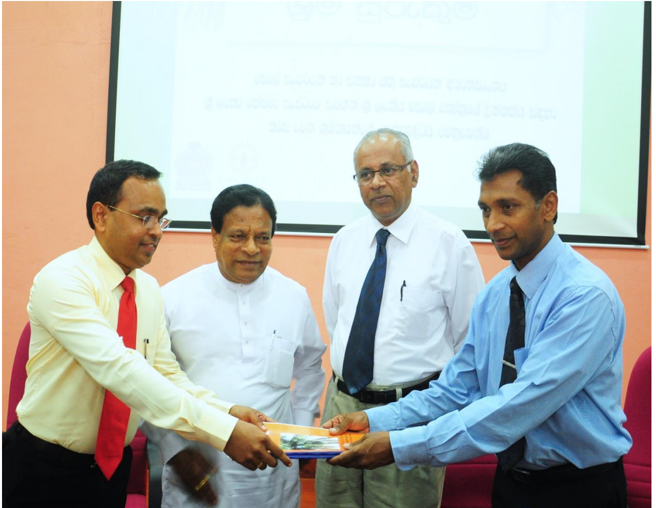
9.3 කප්රුක ග්‍රම සුරැකම වැඩසටහනේ ආරම්භක අවස්ථාවක්

පොල් වගා හා කර්මාන්ත ක්ෂේත්‍රයේ සේවා නියුක්ත දහස් ගණනක් කම්කරුවන්ගේ ජීවිතවලට පවතින අවධානම ඔවුන් ලෙඩරෝග වැළඳුනු අවස්ථාවලදී මුහුණපෑමට සිදුවන මූල්‍ය දුෂ්කරතා හා රැකියාවේ සමාජ පිළිගැනීම අඩුකම සැලකිල්ලට ගෙන එම තත්ත්වයන් පිටුදැකීම සඳහා ආරම්භ කළ නව වැඩසටහනකි. පොල් ක්ෂේත්‍රයේ සේවා නියුක්ත කම්කරුවන් ඉලක්ක ගත කර ගනිමින් ක්‍රියාත්මක කළ මෙම රක්ෂණ වැඩසටහන ශ්‍රී ලංකා රක්ෂණ ස්ථාව සමග ඇතිකරගත් අවබෝධතා ගිවිසුමක් මත ක්‍රියාත්මක වේ.