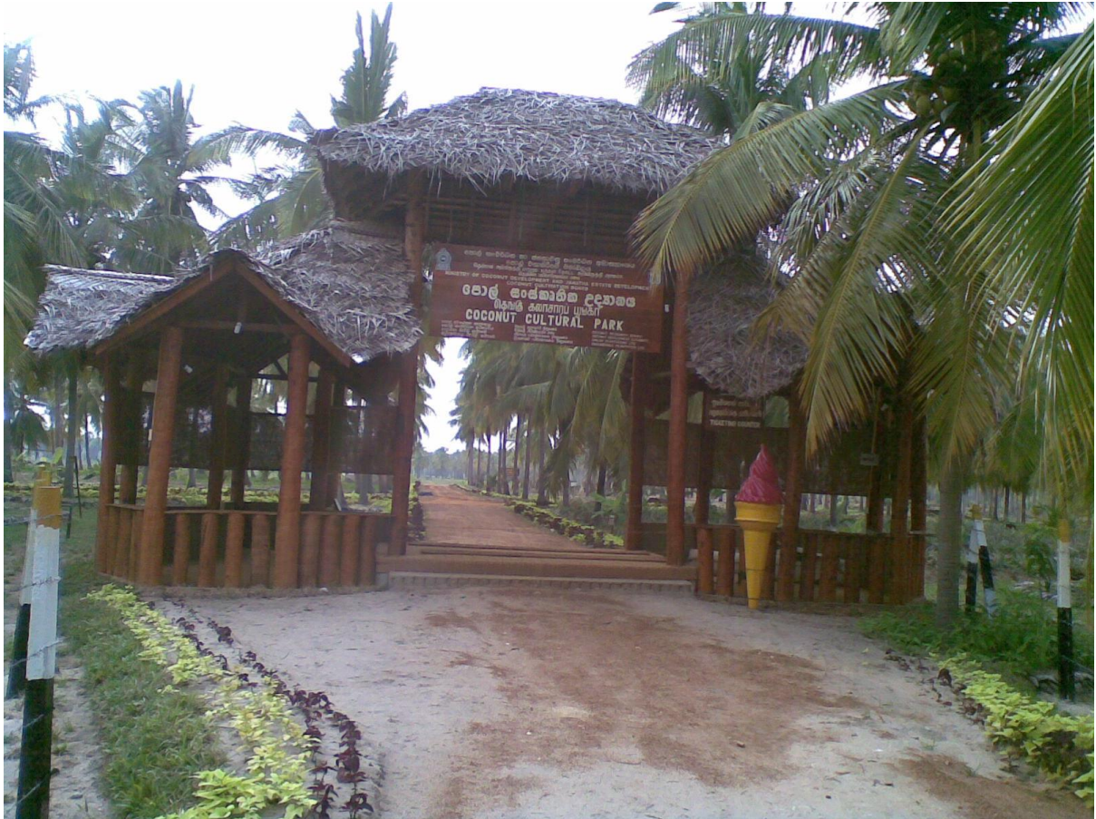
9.5 පායිකුඩා පොල් සංස්කෘතික උද්‍යානයේ පිවිසුම