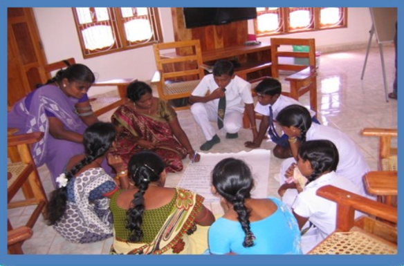
கிராம மட்ட வரைபடம் தயாரித்தல்