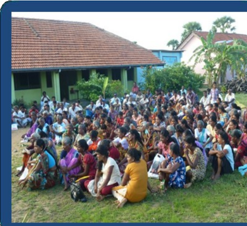
வெள்ள அனர்த்த முகாமை த்துவ ஒத்திகை நிகழ்வு பன்னங்க ண்டி

சுனாமி, வெள்ள அனர்த்தம் போன்றவற்றிற்கான ஒத்திகை நிகழ்வு பூநகரி பிரதேச செயலாளர் பிரிவில் உள்ள பொன்னகர், பள்ளிக்குடா, நாச்சிக்குடா ஆகிய கிராம சேவையாளர் பிரிவுகளிலும் பளை பிரதேச செயலாளர் பிரிவில் அல்லிப்பளை, கிளாலி, கோவில்வயல், புலோப்பளை ஆகிய கிராம சேவையாளர் பிரிவுகளிலும் கண்டாவளை பிரதேச செயலாளர் பிரிவில் உள்ள பிரமந்தனாறு தட்டுவன்கொட்டி ஆகிய கிராம சேவையாளர் பிரிவுகளிலும் நடாத்தப்பட்டது.வெள்ள அனர்த்தத்திற்கான ஒத்திகை நிகழ்வு கரைச்சி பிரதேச செயலாளர் பிரிவில் பன்னங்கண்டி, சிவிக் சென்றர் ஆகிய கிராம சேவையாளர் பிரிவுகளிலும் நடாத்தப்பட்டது.