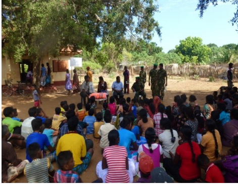
தேசிய சுனாமி ஒத்திகை நிகழ்வு வலைப்பாடு