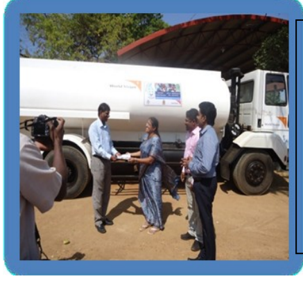
சர்வதேச அனர்த்த குறைப்பு தினம் 2013