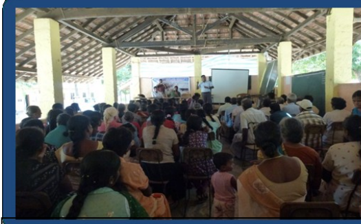
கிராம மக்களுடனான கலந்துரையாடல்