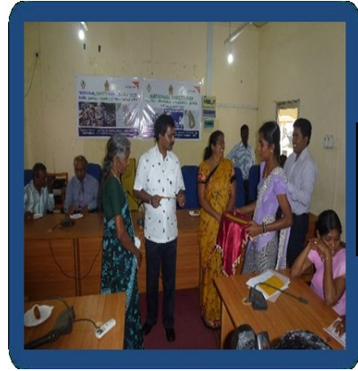
தேசிய அனர்த்த பாதுகாப்பு தினம் 2013

தேசிய அனர்த்த பாதுகாப்பு தினம் 26/12/2013 அன்று மாவட்ட செயலகத்தில் மாவட்ட அரசாங்க அதிபர் தலைமையில் கொண்டாடப்பட்டு 2012 வெள்ள அனர்த்தத்தினால் பாதிக்கப்பட்ட பச்சிலைப்பள்ளி, பூநகரி, கரைச்சி, கண்டாவளை பிரதேச செயலாளர் பிரிவுகளைச் சேர்ந்த மக்களுக்கு அனர்த்த முகாமைத்துவ அமைச்சினால் வழங்கப்பட்ட நிதியினை பாராளுமன்ற உறுப்பினரும் கிளிநொச்சி மாவட்ட மற்றும் பிரதேச அபிவிருத்தி குழு தலைவருமான கௌரவ மு.சந்திரகுமார் அவர்களினால் பாதிக்கப்பட்ட மக்களுக்கான காசோலை வழங்கப்பட்டன.