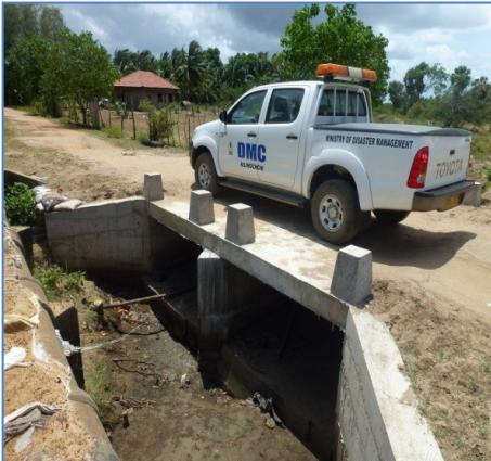
கழிவு வாய்க் கால்

மாவட்ட அனர்த்த முகாமைத்துவ பிரிவினால் கண்டாவளை பிரதேச செயலாளர் பிரிவில் உள்ள புன்னைநீராவி கிராம சேவையாளர் பிரிவில் 3.78 மில்லியன் பெறுமதியான கழிவு வாய்க்கால் புனரமைக்கப்பட்டுள்ளது.