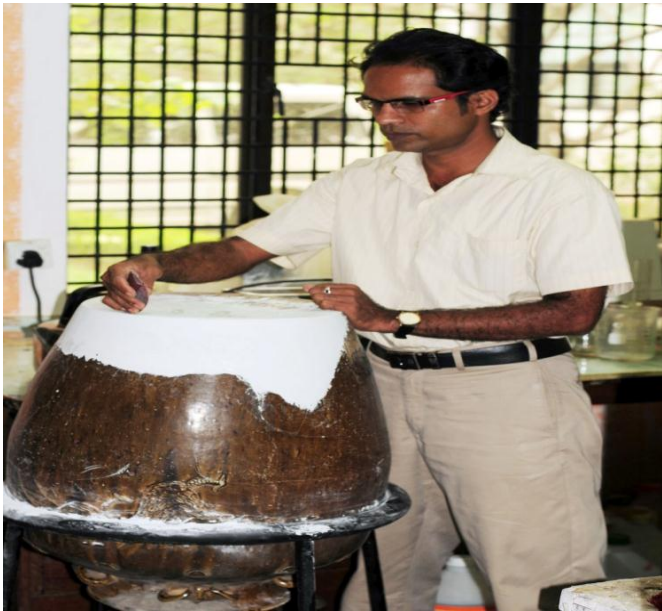
සංරක්ෂණය කරන අවස්ථාව