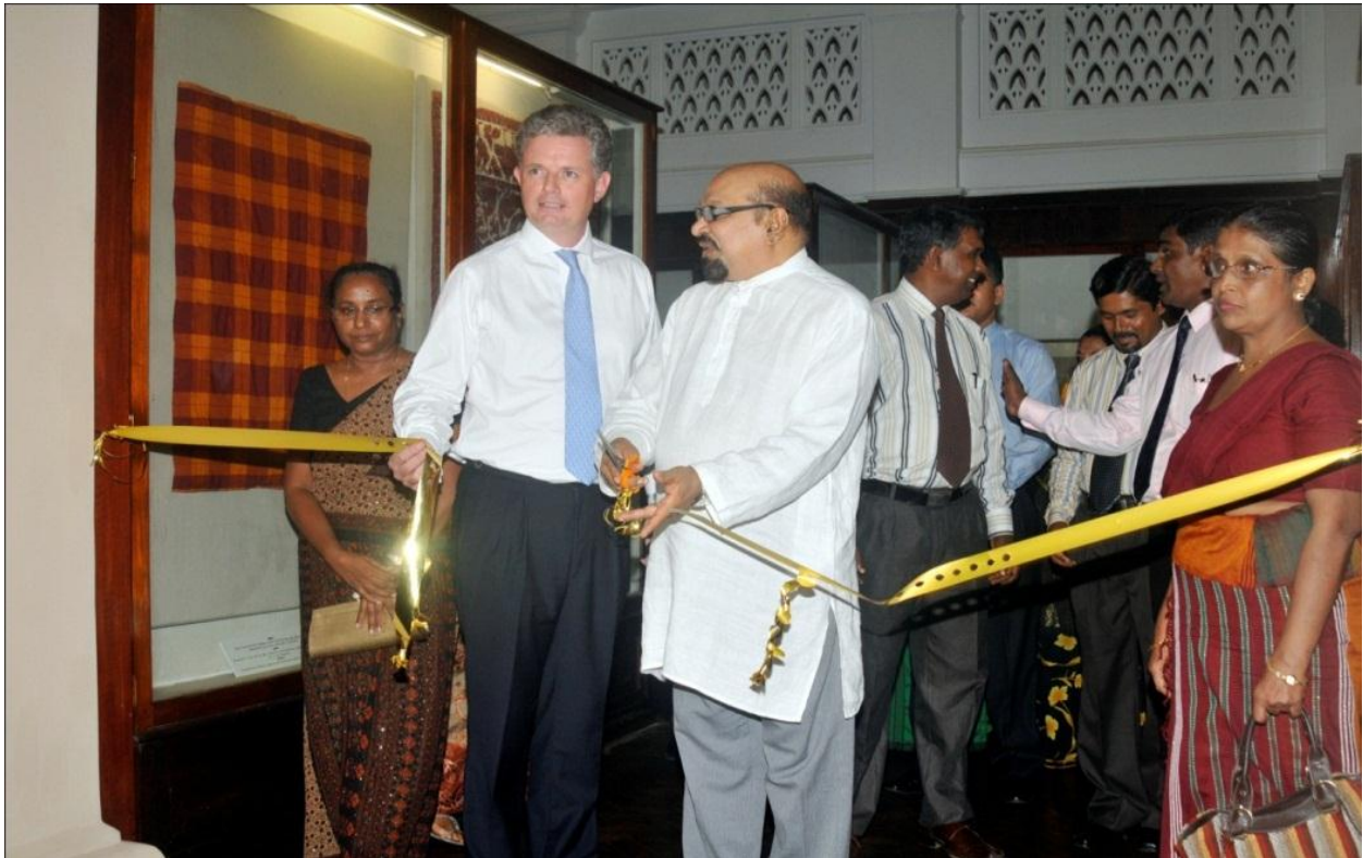
2013/05/17 එන දින රෙදිපිළි හා සෙරමික් ප්‍රර්ගන මැදිරිය විවෘත කිරීම.