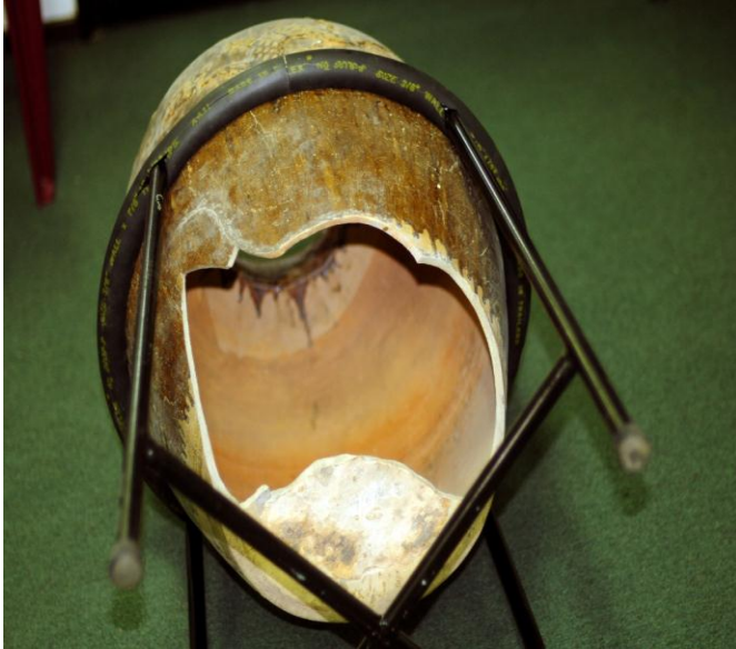
විශාල ප්‍රමාණයේ චීන බුදුම (සංරක්ෂණයට පෙර)