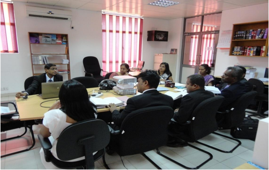
பயிலுனர் நீதிபதிகளுக்கான பயிற்சி அமர்வுகள்