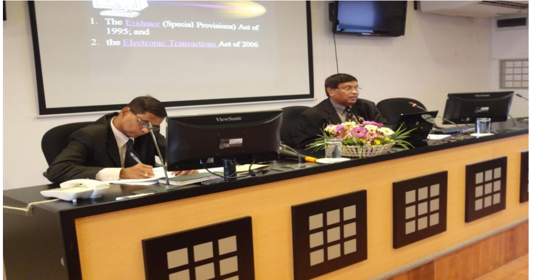
சேவையில் உள்ள நீதிபதிகளுக்கான பயிற்சி அமர்வுகள்