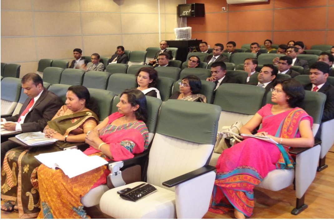
சேவையில் உள்ள நீதிபதிகளுக்கான பயிற்சி அமர்வுகள்