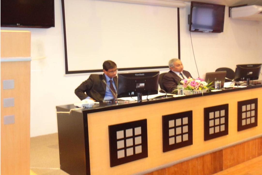
சேவையில் உள்ள தொழில் நியாய மன்றத்தலைவர்களுக்கான பயிற்சி அமர்வுகள்