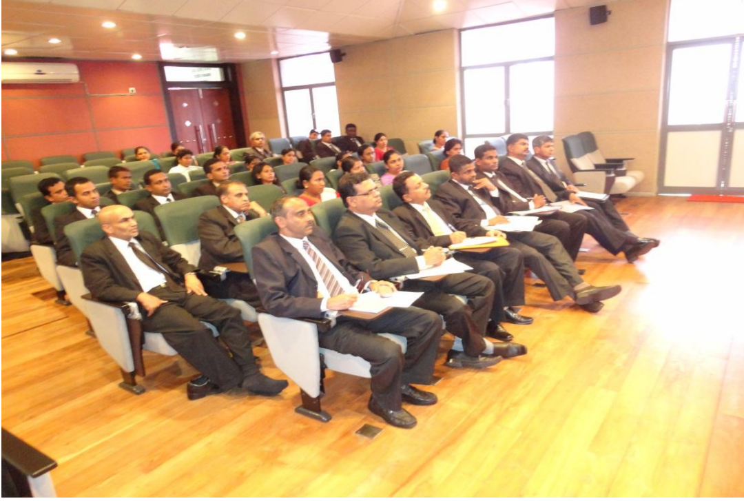
சேவையில் உள்ள தொழில் நியாய மன்றத்தலைவர்களுக்கான பயிற்சி அமர்வுகள்