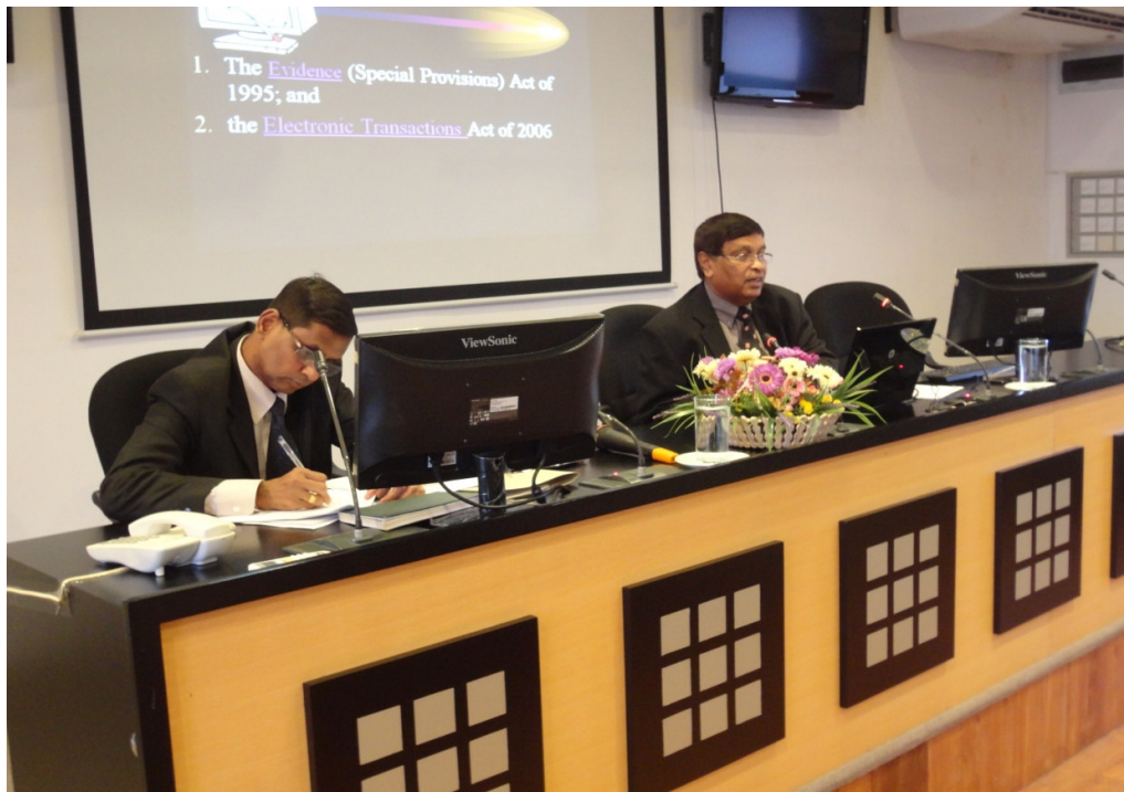
සේවයේ සිටින විනිසුරුවන්ගේ පුහුණු සැසි