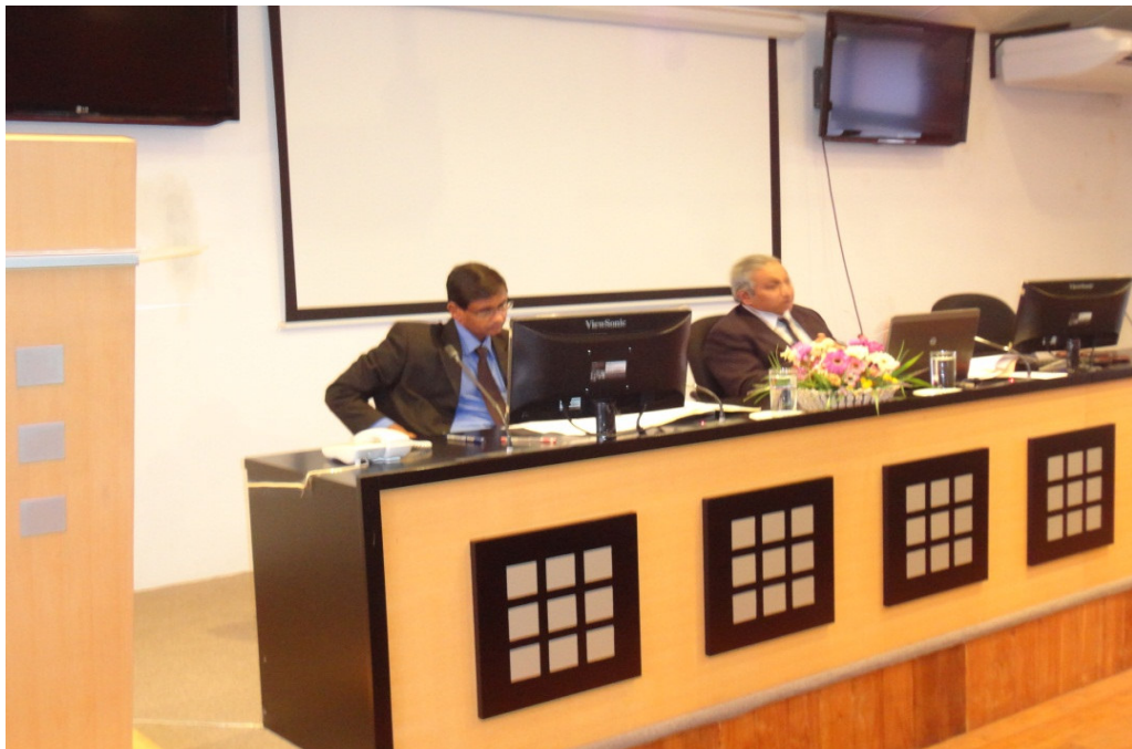
සේවයේ සිටින කම්කරු විනිශ්චය සභා සභාපතිවරුන් වෙනුවෙන් පවත්වන ලද ප්‍රභූණු සැසි