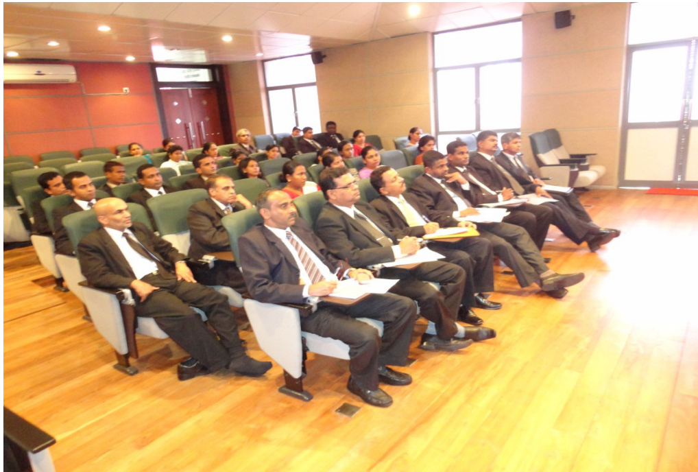
සේවයේ සිටින කම්කරු විනිශ්චය සභා සභාපතිවරුන් වෙනුවෙන් පවත්වන ලද පුහුණු සැසි