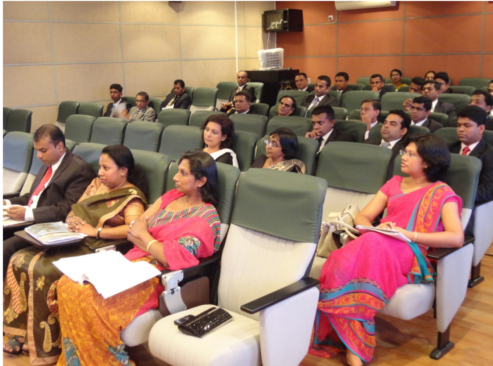
සේවයේ සිටින විනිසුරුවන්ගේ ප්‍රභූණු සැසි