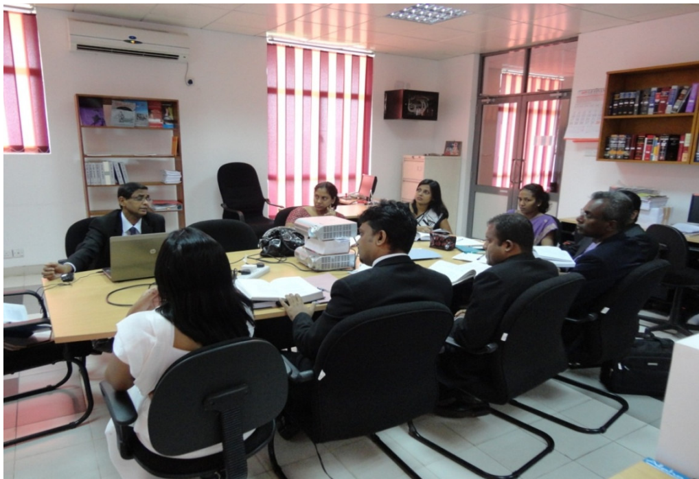
පුහුණු වන විනිශ්චරවන්ගේ පුහුණු සැසි