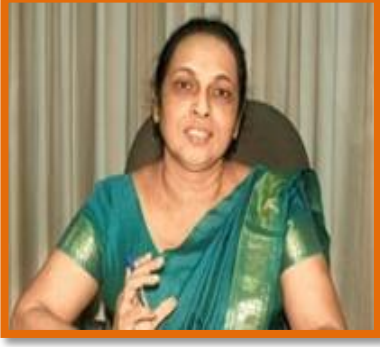
சிரம வாசனா நிதியச் சபைப் பணிப்பாளர்/ தொழில் ஆணையாளர் அதிபதியின் செய்தி

தொழில், தொழில் உறவுகள் அமைச்சினதும், அதன் அதிகாரத்தின் கீழ் வருகின்ற நிறுவனங்களின் பிரதான பங்கு பல்வேறு தொழில் சட்டங்களை சட்டவாக்கம் செய்வதும் பணியாளர்களின் சேமநலனுக்கான கருத்திட்டங்களை நடைமுறைப்படுத்துவதுமாகும் என்பதுடன், தொழில் அமைச்சின் கீழ் வருகின்ற தொழில் திணைக்களம் 45 தொழில் சட்டங்களை சட்டவாக்கம் செய்துள்ளது. இந்த தொழில் சட்டங்கள், பணியாளர்கள் தொழிலின் பின்னர் ஓய்வூதிய வாழ்க்கையைப் பெறுவதனை வழங்கியுள்ள அதே வேளையில், சிறந்த சேவை நிபந்தனைகள், ஒழுங்குவிதிகள், பணியாளர் பாதுகாப்பு மற்றும் வேலைத்தல கூட்டுறவு மற்றும் சேமநலன் தொடர்பில் தொழில்துறை சுகாதாரம், ஒழுங்குகள் மற்றும் ஒழுங்குவிதிகளும் மிகவும் முக்கியமானவை.