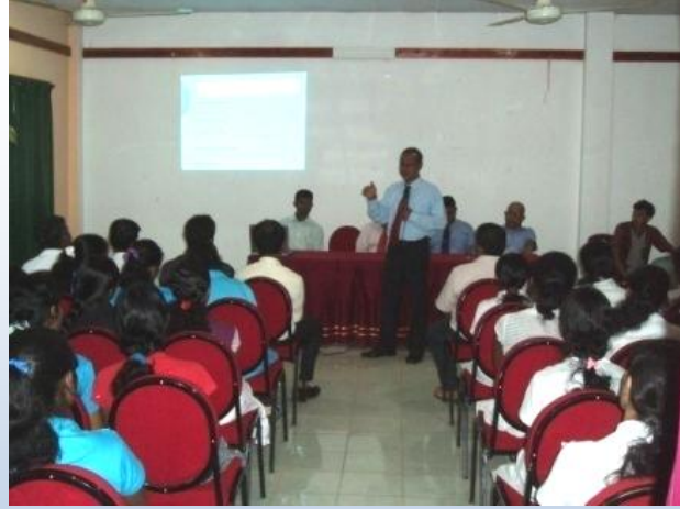
அனுராதபுரத்தில் டயற்ற கிருலவினை முன்னிட்டு பணியாளர்களுக்கு நடத்தப்பட்ட விழிப்புணர்வு நிகழ்ச்சித்திட்டம்