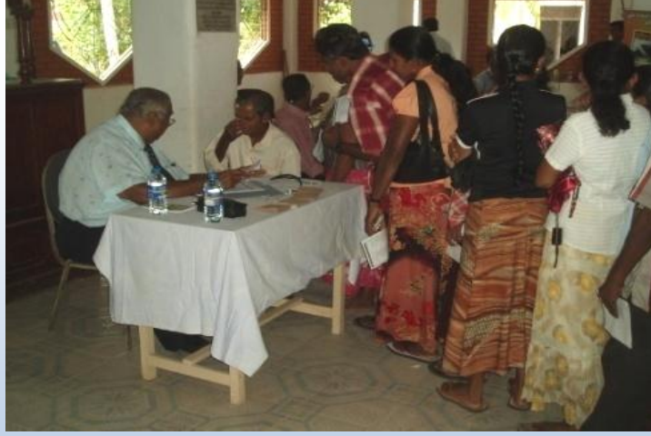
பணியாளர்களின் சுகாதாரத்தை அதிகரிப்பதற்கு டெல்தற சுமணறாம விகாரையில் பணியாளர்களுக்கு மருத்துவ மற்றும் கண் பரிசோதனை கிளினுக்குகளை நடத்துதல்

1. தொழிற் செயலகத்தின் 10 ஆவது தளத்தில் மருத்துவ கிளினுக்குகளை நடத்தியமை.