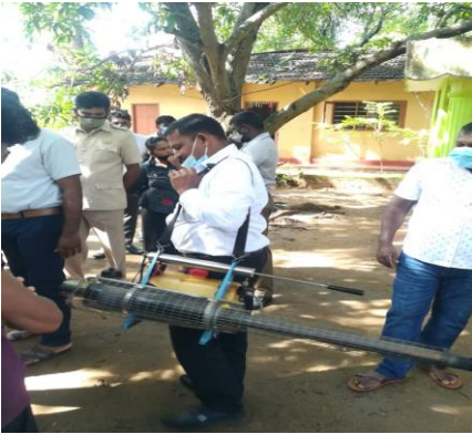
டெங்கு ஒழிப்பு நிகழ்ச்சித்திட்டம் - மட்டக்களப்பு

டெங்கு நோய்க்காவியான நுளம்புகள் பெருகும் இடங்களை சோதனையிடல் மற்றும் சுத்தம் செய்தல் போன்ற பணிகள் பல்நோக்கு அபிவிருத்தி உதவியாளர்களால் மேற்கொள்ளப்பட்டன. இங்கு பொதுச் சுகாதார பரிசோதகர் மற்றும் ஏனைய கள் உத்தியோகத்தர்களுக்கு உதவியளித்தமை முக்கியமானதாகும்.