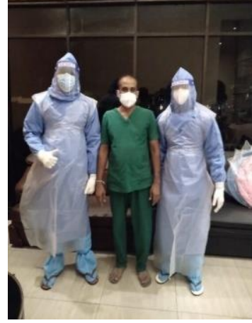
கொவிட் 19 தொற்றுத் தடுப்பு பணிகளில் ஈடுபடுகின்ற உதவியாளர்கள்