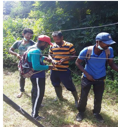
மின்வேலி நிர்மாணிப்பு மற்றும் பராமரிப்பு - மட்டக்களப்பு மாவட்டம்