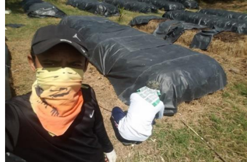
சேதன உர உற்பத்தி - திருகோணமலை மாவட்டம்

காட்டு யானைகள் உலாவுகின்ற பிரதேசங்களில் வாழ்கின்ற மக்களின் வாழ்வுக்கு வசதிகளை வழங்குவதற்காக பல்நோக்கு அபிவிருத்தி உதவியாளர்கள் அதிகமானவர்கள் வனசீவராசிகள் பாதுகாப்புத் திணைக்களத்தின் கீழ் மின்வேலிப் பாதுகாப்புக் கடமைகளுக்காக ஈடுபடுத்தப்பட்டுள்ளனர். காட்டு யானைகள் கிராமத்திற்குள் உட்பிரவேசிப்பதைக் கட்டுப்படுத்தல் மற்றும் மின்வேலிப் பராமரிப்புக்கள் இவர்களின் முக்கிய கடமைகளாகும்.