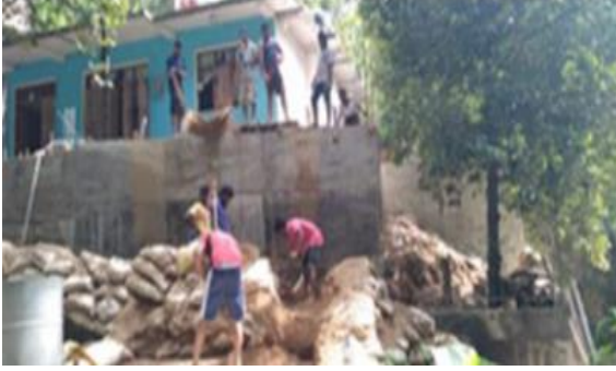
மண்சரிவால் பாதிக்கப்பட்ட வீட்டைத் துப்பரவாக்கும் பணியில் - உடுநுவர

இயற்கை அனர்த்தங்களின் போது இடர்களுக்குள்ளாகிய மக்களுக்கு ஆதரவளிப்பதற்காக பல்நோக்கு அபிவிருத்தி உதவியாளர்கள் தமது ஒத்துழைப்புக்களை வழங்கிய சந்தர்ப்பங்கள் ஏராளமானவை. குறிப்பாக வெள்ள அனர்த்தத்தின் போது இடம்பெயர்ந்த குடும்பங்களுக்கு நிவாரணப் பொதிகள் விநியோகம், பல்வேறு பரீட்சைகளுக்காகத் தோற்றுகின்ற மாணவர்களுக்கு பரீட்சை மண்டபங்களுக்கு செல்வதற்கு போக்குவரத்து சிரமங்கள் கொண்ட மாணவர்களுக்கு வெள்ளத்திலிருந்து அக்கரைக்கு எடுத்துச் செல்லல், மண்சரிவு அனர்த்தங்களுக்குள்ளாகியவர்களுக்கு நிவாரணங்களை வழங்கல் மற்றும் வீட்டுப் புனரமைப்புக்களுக்கு ஒத்துழைப்பு வழங்கல், வறுமைப்பட்ட குடும்பங்களுக்கு நிவாரணப் பொதிகளை வழங்கல் போன்ற பணிகளை மிகவும் அர்ப்பணிப்புடன் மேற்கொண்டனர்.