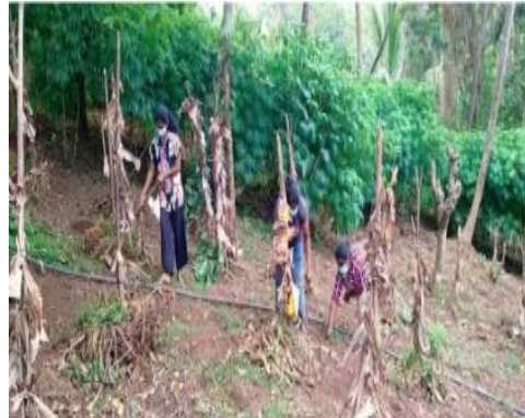
தரிசு நிலங்களில் பயிரிடலுக்காக தயாராகின்ற பல்நோக்கு அபிவிருத்தி உதவியாளர்கள் - மாத்தளை மாவட்டம்