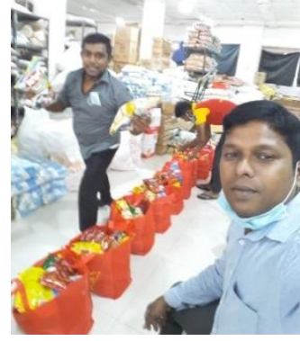
நிவாரணப் பணிகளில் ஈடுபடும் போது