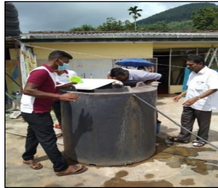
டெங்கு ஒழிப்பு நிகழ்ச்சித்திட்டம்- பதுளை நகரம்