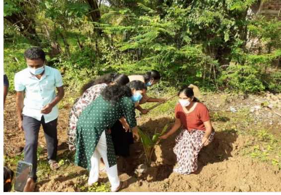
மரநடுகை நிகழ்ச்சித்திட்டம் - மட்டக்களப்பு மாவட்டச் செயலகம்

அரசு கொள்கைத் தீர்மானத்திற்கமைய சேதன உர உற்பத்தியை விரிவாக்கம் செய்வதற்காக பல்நோக்கு அபிவிருத்தி உதவியாளர்கள் தமது ஒத்துழைப்பை வழங்கியுள்ளதன், திருகோணமலை மாவட்டத்தில் குறித்த நிகழ்ச்சித்திட்டம் வெற்றிகரமாக மேற்கொள்ளப்பட்டது.