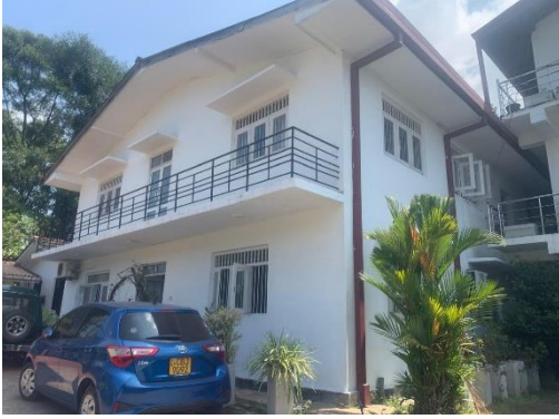
கம்பஹா கமநல அபிவிருத்தி மாவட்ட அலுவலகத்தின் பழுதுபார்ப்பு

தலைமை அலுவலகம் மற்றும் மாவட்ட அலுவலகங்களில் பணியாற்றும் அலுவலர்களின் மற்றும் சேவை பெறுநர்களின் வினைத்திறனை மேம்படுத்தும் நோக்கில் 281-1-1-0-2001 செலவினத் தலைப்பினூடாக ஒதுக்கீடு செய்யப்பட்ட 20 மில்லியன் ரூபா நிதி ஏற்பாட்டின் கீழ் 09 மாவட்ட அலுவலகங்களின் 18 திட்டங்களின் பழுதுபார்ப்பு நடவடிக்கைகள் நிறைவு செய்யப்பட்டன. 2024.12.31 ஆம் திகதியன்று செலவிடப்பட்ட தொகை 19.23 மில்லியன் ரூபாவாகும். பௌதிக முன்னேற்றம் 100% ஆகும்.