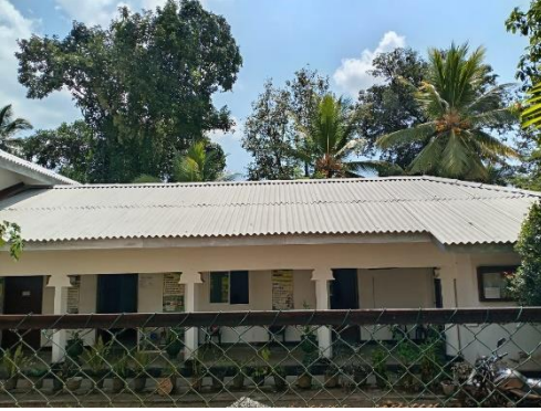
கம்பஹா மாவட்டத்தின் வேகே கமநல சேவை நிலையம்

கமநல சேவை நிலையங்களில் பணியாற்றுகின்ற அலுவலர்களின் மற்றும் சேவை பெறுநர்களின் வினைத்திறனை மேம்படுத்தும் நோக்கில் மற்றும் கமநல சேவை நிலையங்கள் மற்றும் உரக் களஞ்சியசாலைகளின் இயலளவை அதிகரிக்கும் நோக்கில் 281-2-2-0-2001 செலவினத் தலைப்பினூடாக ஒதுக்கீடு செய்யப்பட்ட 600 மில். ரூபா நிதி ஏற்பாட்டின் கீழ் தலைமை அலுவலகம், கமநல சேவை நிலையங்கள் மற்றும் உரக் களஞ்சியசாலைகளின் 203 பழுதுபார்ப்பு நடவடிக்கைகள் மேற்கொள்ளப்பட்டதுடன், அவற்றில் 195 திட்டங்களின் பணிகள் நிறைவு செய்யப்பட்டன. 2024.12.31 ஆம் திகதியன்று செலவிடப்பட்ட தொகை 523.04 மில்லியன் ரூபாவாகும். பௌதிக முன்னேற்றம் 82 % ஆகும்.