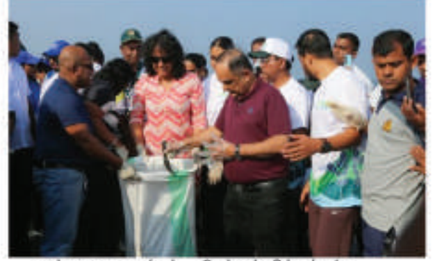
கடற்கரையை சுத்தம் செய்யும் திட்டங்கள்

கரையோரப் பாதுகாப்புக்கான சமூக பங்களிப்பை ஊக்குவிக்க, 35,250 தொண்டர்களுடன் 463 கரையோர இடங்களில் நாடு முழுவதும் தூய்மைப்படுத்தும் திட்டம் வெற்றிகரமாக நடத்தப்பட்டது. அதன் பிரகாரம், கொழும்பு, கம்பஹா, களுத்துறை, யாழ்ப்பாணம் மற்றும் காலி மாவட்டங்களில் 39 கடற்கரைப் பாதுகாவலர்கள் தற்போது