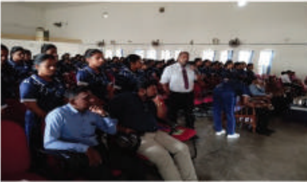
விழிப்புணர்வு நிகழ்ச்சிகளை நடத்துங்கள்

ஸ்ரீ ஜயவர்தனபுர பல்கலைக்கழகத்தின் நகர்ப்புற மற்றும் தீர்வாழ் உயிரியல் வளங்கள் பீடத்தின் மாணவர்கள் மற்றும் விரிவுரையர்களுக்காக தற்போதைய கற்றாடல் கொள்கைகள், நகர்ப்புற