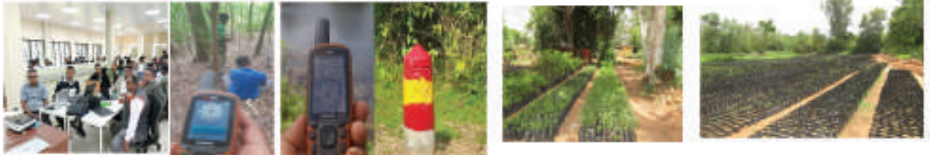
வனப் பாதுகாப்பு தகவல் திட்டத்தின் கீழ் 2025 ஆம் ஆண்டில் சுமார் 50 ஹெக்டேயர் சதுரபுறப் பகுதிகளை சுத்தம் செய்தல்

புவிச்சரிதவியல் தகவல் மற்றும் வனக் உயியல் பல்வகைமை மற்றும் நீர்மூலங்கள்/கணக்கெடுப்பு பிரிவால் நடத்தப்படும் வெளிக்கள நிலைகள் பாதுகாப்புப் பிரிவால் காடுகளை அலுவலர்களுக்கான விழிப்புணர்வூட்டல் மற்றும் மீளமைப்பதற்கும் சமயத் தலங்களில் நடுவதற்கும் பயிற்சி வழங்கல் நிகழ்ச்சித்திட்டங்களை நடத்துதல், மரக்கன்றுகளை உற்பத்தி செய்தல், GPS ஐப் பயன்படுத்தி வன எல்லைகளை அளத்தல், வரைபடங்களைத் தயாரித்தல் மற்றும் எல்லை தூண்களை நடுதல்