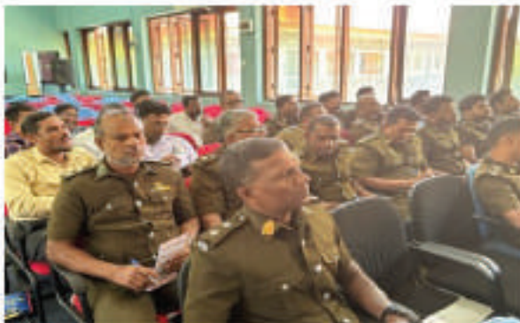
பொது அலுவலர்களுக்கான சுகாதார விழிப்புணர்வு நிகழ்ச்சித்திட்டம்

வளி வனங்கள் முகாமைத்துவம் நிலையம் மீலம் பங்குதாரத் தரப்பினர்களின் ஆலோசனைக் கூட்டங்கள், தேசிய சுற்றாடல் செயல் திட்டம் (2022-2030) பற்றிய முன்னேற்ற மீளாய்வுக் கூட்டம் மற்றும் வாகன புகை வெளியேற்ற நிதி தொடர்பான முன்னேற்ற மீளாய்வுத் நிகழ்ச்சித்திட்டம் மத்திய சுற்றாடல் அதிகார சபை மற்றும் தேசிய கட்டிட ஆராய்ச்சி நிறுவனத்துடன் இணைந்து கூட்டாக நடாத்தப்பட்டது.