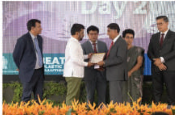
கார்பன்-நடுநிலை கொண்டாட்டத்திற்கான சான்றிதழை வழங்குதல்

உலக சுற்றாடல் தினக் கொண்டாட்ட நிகழ்ச்சித்திட்டம் (2024 யூன் 05.)