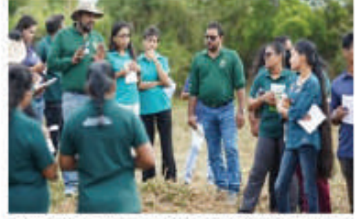
அலுவலர்களுக்கான பயிற்சி நிகழ்ச்சித் திட்டங்களை நடாத்துதல்

மேம்படுத்துவதற்கான திறனைக் கட்டியெழுப்பும் நோக்கில் கொண்டு இந்தச் செயலமர்வு நடாத்தப்பட்டது.