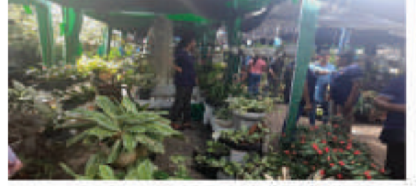
மலர் கண்காட்சி கூடம்