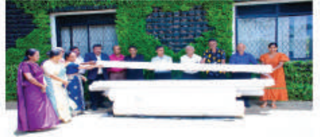
மலர் வளர்ப்பாளர்களுக்கான பொருட்களை