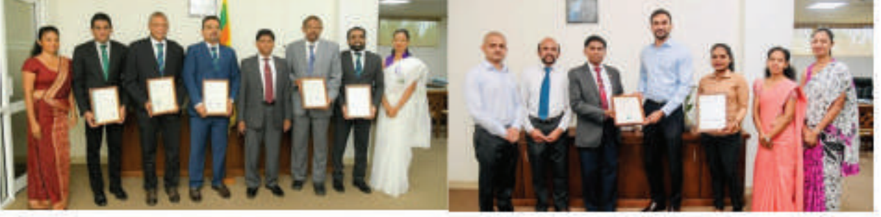
புகழை இல்ல வாயு சரிபார்ப்பு - சான்றிதழ் வழங்கும் விழா

முறையான மற்றும் அறிவியல் அடிப்படையிலான அணுகுமுறையை SBTA வழங்குகின்றன. பாரிஸ் ஒப்பந்தத்தில் காட்டப்பட்டுள்ளவாறு தொழில்துறைக்கு முந்திய நிலைகளை விட 2 செல்சியஸ் ஐ விடவும் குறைவாக புவி வெப்பமடைதல் எல்லையை கட்டுப்படுத்தும் உலகளாவிய முயற்சியுடன் ஒத்துப்போகும் வகையில் இந்த இலக்குகள் திட்டமிடப்பட்டுள்ளன.