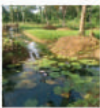
கதற்பொல விலாசாயப் பள்ளை அபிவிருத்தி