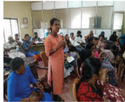
அறிவுறுத்தல் நிகழ்ச்சித்திட்டங்களை நடத்துதல்

தாக்கங்கள் மூலம் இலங்கையிலும் இந்தியாவிலும் ஆபத்துக்களுக்கு உட்படக்கூடிய சமூகங்களின் தாக்குப்பிடிக்கும் தன்மையை வலுப்படுத்துவதற்கான* (ADAPT4R) பிராந்திய கருத்திட்டம் ஆரம்பிக்கப்பட்டுள்ளது. இங்கு பிராந்திய ஒருங்கிணைந்த அணுகுமுறையைப் பயன்படுத்திக்கொண்டு இலங்கையின் வறண்ட வலயத்தின் காலநிலை மாற்றங்களுக்கு உட்படுகின்ற அதனால் பாதிக்கப்படக்கூடிய சமூகங்களின் காலநிலை மாற்றங்களுக்குத் தாக்குப்பிடிக்கும் வலுப்படுத்தல் மற்றும் உணவுப் பாதுகாப்பை உறுதி செய்தல் / ஏற்படுத்தல் ஆகியவற்றை நோக்கமாகக் கொண்டு இந்த கருத்திட்டம், இலங்கையின் மொளராகலை, திருகோணமலை, மன்னார், முல்லைத்தீவு, வவுனியா மற்றும் குருநாகல் மாவட்டங்களில் செயல்படுத்தப்படுகின்றது.