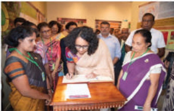
இலங்கை ஜனநாயக சோசலிசக் குடியரசின் பிரதமர் டாக்டர் ஹரிணி அமரதீரயவின் தலைமையில் மூன் நினைவு அருங்காட்சியகம்/கலைக்கூடம் பொதுமக்களுக்குத் திறக்கப்பட்டது.

1. மூன் ஞாயிற்றுக்கிழமை நாதனசலை/அரும்பொருட் காட்சிசாலை 2025 செப்டெம்பர் 28, ஆம் திகதி கௌரவ பிரதமர் டாக்டர் ஹரிணி அமரதீரயவின் அவர்களின் தலைமையில் பொதுமக்களுக்காகத் திறந்துவைக்கப்பட்டது. பூங்காவின் பண்டைய பாரம்பரியத்தை விபரிக்கும் காட்சிகள் மற்றும் கண்காட்சிகளுக்கு மேலதிகமாக அருங்காட்சியகத்தில் பல்லாடக முல்புடிபுயா கண்காட்சிகளும் உள்ளன.