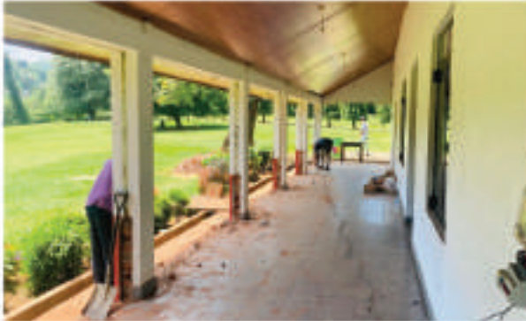
பூங்கபேராதனை ராயல் தாவரவியல் ாவில் உள்ள உணவகக் கட்டிடத்தின் புதுப்பித்தல்