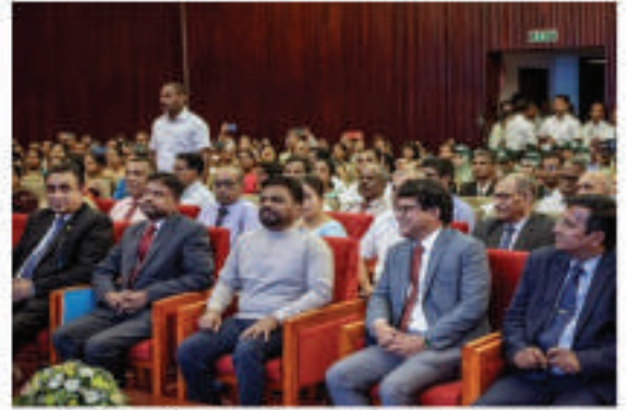
சுற்றுச்சூழல் பைலட் ஜனாதிபதி பதக்க விருது வழங்கும் விழா 2025