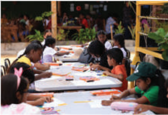
பள்ளி கலைப் போட்டிகள்

சமுத்திர சுற்றாடல் பாதுகாப்பு அதிகார சபை மூலம் உலக கடல் தினத்தை (யூன் 2, 2025) முன்னிட்டு தேசிய மற்றும் மாவட்ட மட்டங்களில் தொடர்ச்சியான செயல்பாடுகளுடன் கொண்டாடப்பட்டது. கொழும்பு துறைமுக நகரில் (Port City) நடைபெற்ற தேசிய கடல் தின நிகழ்வில் அரச அதிகாரிகள், அரச சார்பற்ற நிறுவனங்கள் மற்றும் பொதுமக்கள் உட்பட சுமார் 2000 பேர் பங்கேற்றனர். இந்த நடவடிக்கைகளில்