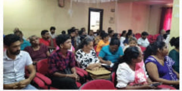
இரத்தினபுரி மாவட்டத்தில் உள்ள எம்பிலிப்பிட்டிய பிரதேச செயலகத்தில் இந்த நிகழ்ச்சி நடைபெற்றது.

இந்தத் நிகழ்ச்சித் திட்டத்தின் கீழ், பிராந்திய நிர்வாக அலுவலர்களுக்கான திறன் விருத்தி வதிவிட