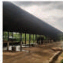
சிறிய பூனை குடும்பத்திற்கான ஆரணியம்