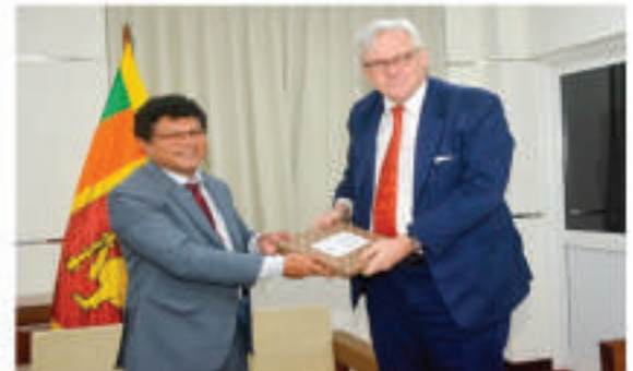
இலங்கைக்கான பிரிட்டிஷ் உயர் ஸ்தானிகருடனான இராஜதந்திர சந்திப்பு

இலங்கைக்கான இந்தோனேசிய அரசாங்கத்தின் கௌரவ தூதுவர் மற்றும் கௌரவ கற்றாடல் அமைச்சர் ஆகியோருக்கு இடையிலான சந்திப்பு 2025 ஆகஸ்ட் 18, ஆம் திகதி நடத்தப்பட்டது.