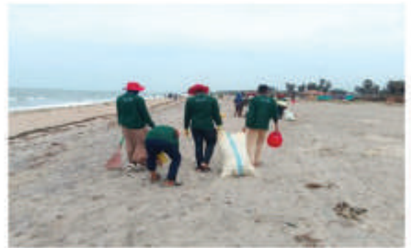
கடற்கரை சுத்தம் செய்தல் சிரமதாளம்

இலங்கை செஞ்சிலுவை சங்கம் மன்னார் கிளையினால் மன்னார் நகர சபை, கிரி கடலோர சிவில் பாதுகாப்பு படை ஆகியவற்றுடன் இணைந்து ஏற்பாடு செய்யப்பட்ட கடற்கரை சுத்தம் செய்யும் வேலைத்திட்டமொன்று (சிரமதாளம்) மன்னார் தீவில் உள்ள கிரி கடற்கரையில் நடைபெற்றது. பிளாஸ்டிக் மற்றும் மாசுகள் இல்லாத கடற்கரையை பராமரித்தல்., கடலோர பாதுகாப்புக்கான சமூக பொறுப்பை ஊக்குவித்தல் மற்றும் பங்குதார தரப்பினர்களிடையே ஒத்துழைப்பை வளர்ப்பதன் மூலம் சுற்றாடல் நுட்பமான சுற்றுலா கைத்தொழிலை மேம்படுத்துதல் என்பன இந்த நிகழ்வின் நோக்கமாகும். இதற்காக, இலங்கை செஞ்சிலுவை சங்க தன்னார்வலர்கள், கடற்படை அதிகாரிகள், நகர சபைப் பிரதிநிதிகள், சமகை மற்றும் சிவில் பாதுகாப்பு படைகளின் உறுப்பினர்கள் உட்பட 70 க்கும் மேற்பட்டோர் சுத்தம்செய்தல் நடவடிக்கைகள், கழிவுகளை அகற்றுதல் மற்றும் விழிப்புணர்வூட்டல் நிகழ்ச்சித் திட்டங்களில் ஈடுபட்டனர்.