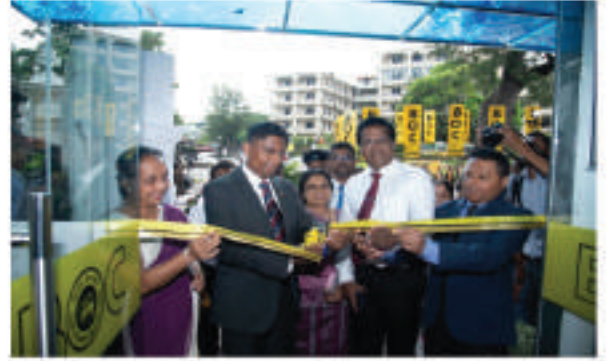
பேராதனைய அரச தாவரவியல் பூங்காவின் பிரதான நுழைவாயிலுக்கு அருகில் இலங்கை வங்கியின் புதிய கிளை திறந்து வைக்கப்பட்டது.

2. பேராதனையில் உள்ள அரச தாவரவியல் பூங்காவின் பிரதான நுழைவாயிலுக்கு அருகில், இலங்கை வங்கியின் புதிய கிளை அலுவலகம் ஒன்று 2025 செப்டெம்பர் 28, ஆம் திகதி உத்தியோகபூர்வமாகத் திறந்து வைக்கப்பட்டது. இது தாவரவியற் பூங்காவை பார்வையிட வருகின்ற பார்வையாளர்கள், ஊழியர்கள் மற்றும் சுற்றியுள்ள சமூகத்தினர் நவீன வங்கிச் சேவைகளை இதன் மூலம் எளிதாகப் பெற்றுக்கொள்வதற்கு இது உதவும்.