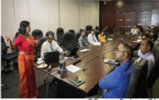
காபன் வர்த்தகம் நிதி கருவிகள் குறித்த உள்ளிட்ட காலநிலை விழிப்புணர்வு

காலநிலை நிதி அறிவுறுத்தல் அமர்வு காலநிலை நடவடிக்கைக்கான பேணதகு நிதி மற்றும் காபன் சந்தைகளை உருவாக்குதல், இந்த நிகழ்ச்சித்திட்டம் பிரதமர் அலுவலகம், சுற்றாடல் அமைச்சு மற்றும் Global Green Growth Institute (GGGI) ஆகியவற்றால் ஏற்பாடு செய்யப்பட்டது. ஓக்கும் மேற்பட்ட அலுவலர்களுக்கு காபன் வர்த்தகம் உட்பட காலநிலை நிதிக் கருவிகள் தொடர்பான அறிவுறுத்தல் அமர்வுகள் நடத்தப்பட்டன.