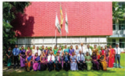
பிராந்திய நிர்வாக திறன் மேம்பாட்டு அலுவலர்களுக்கான குடியிருப்பு பட்டறை

நாடு தழுவிய ESA வரைபடமாக்கல் மதிப்பீடு நடாத்தப்பட்ட வருவதோடு முடிவெடுக்கும் கருவியாக ஒரு தரவுத்தளம் மற்றும் வலைத்தளம் உருவாக்கப்பட்டு வருகிறது. இதுவரை, அறிவியல் பகுப்பாய்வு மூலம் இலங்கை முழுவதும் 139 ESAகள் அடையாளம் காணப்பட்டுள்ளன. ESA-வை செயல்படுத்துவதற்கான தேசிய வழிகாட்டுதல்கள் வரைவு செய்யப்பட்டுள்ளதோடு பங்குதாரர்களின் ஆலோசனைகள் மூலம் வழிகாட்டுதல்களின் நடைமுறைச்சாத்தியப்பாடு உறுதி செய்யப்பட்டுள்ளது.