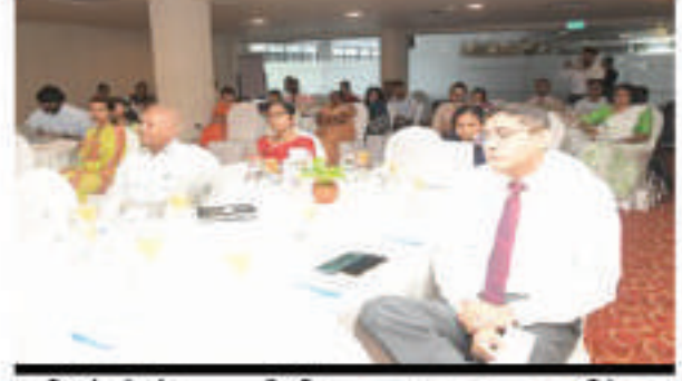
திருத்தப்பட்ட தேசிய பசுமை அறிக்கை வழிகாட்டுதல்கள் குறித்த சரிபார்ப்பு பட்டறை

ஐக்கிய நாடுகள் சபையின் உறுப்பினர் ஒருவரும் மற்றும் ஐக்கிய நாடுகள் சபையின் பத்து ஆண்டு நிகழ்ச்சித்திட்டம் (10-Year Framework of Programs - 10 YFP) மற்றும் 2030 பேணதகு அபிவிருத்திக்கான நிகழ்ச்சி நிரலின் உறுப்பினருமான இலங்கை, பேணதகு நுகர்வு மற்றும் உற்பத்தியை (SCP) ஊக்குவிக்கிறது.