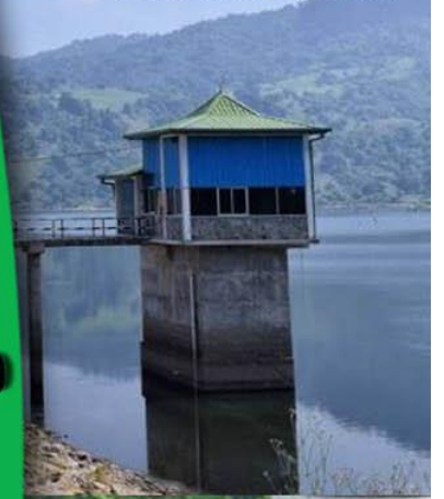
Inginiyagala Power Station - Ampara