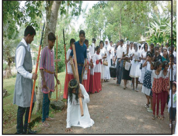
காலி மறை மாவட்ட தவக்கால நாடகம்