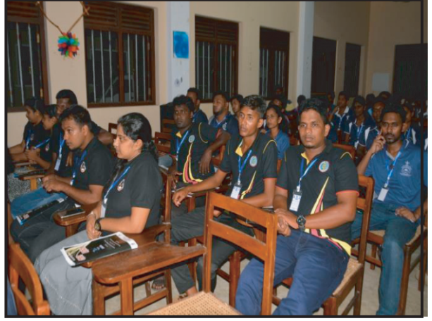
காலி மறை மாவட்ட இளைஞர் நிகழ்ச்சித்திட்டம்