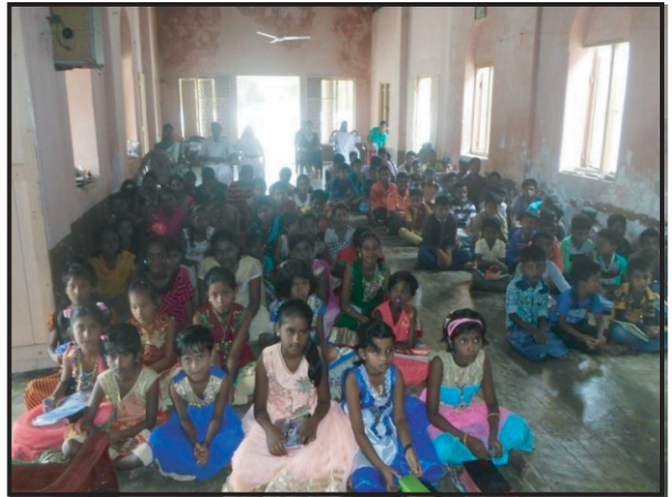
சாந்திபுரம் மறைக்கல்வி நிகழ்ச்சித்திட்டம்