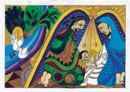
நத்தார் வாழ்த்து அட்டைக்காக தெரிவு செய்யப்பட்ட சித்திரம்