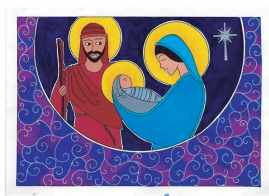
அரசு நத்தார் வைபவத்தின் அழைப்பிதழின் பொருட்டு தெரிவுசெய்யப்பட்ட சித்திரம்