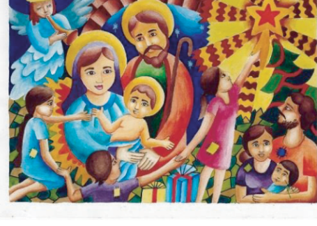
ஒவ்வொரு குழுவிலும் முதலாவது இடத்தை வென்ற சித்திரங்கள்