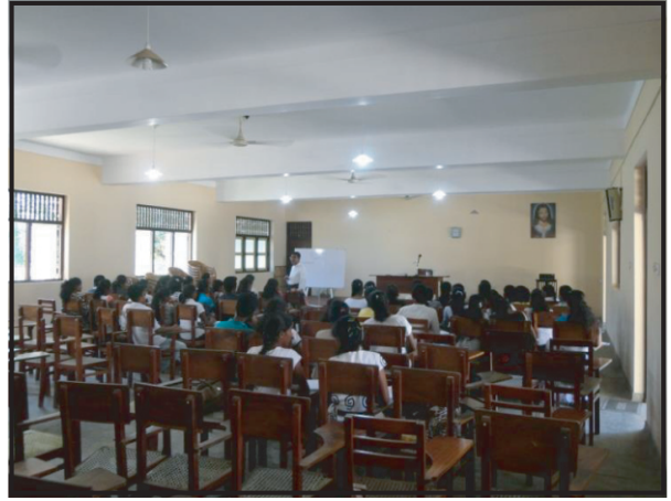
வென்னப்புவ மறைக்கல்வி நிகழ்ச்சித்திட்டம்