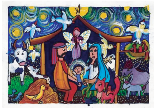
நத்தார் அஞ்சல் முத்திரை பொருட்டு தெரிவு செய்யப்பட்ட சித்திரங்கள்