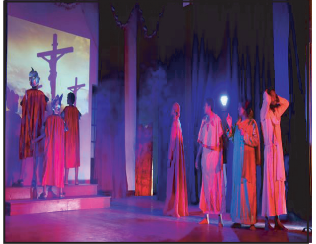
கண்டி மறை மாவட்ட தவக்கால நாடகம்