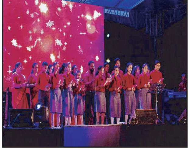
லங்கா சபை தொடர்பாடல் நத்தார் பாடல் மியசிய