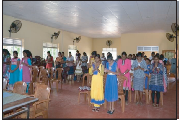
மட்டக்களப்பு மறை மாவட்டத்தின் ஆன்மீக அளுமை நிகழ்ச்சித்திட்டம்