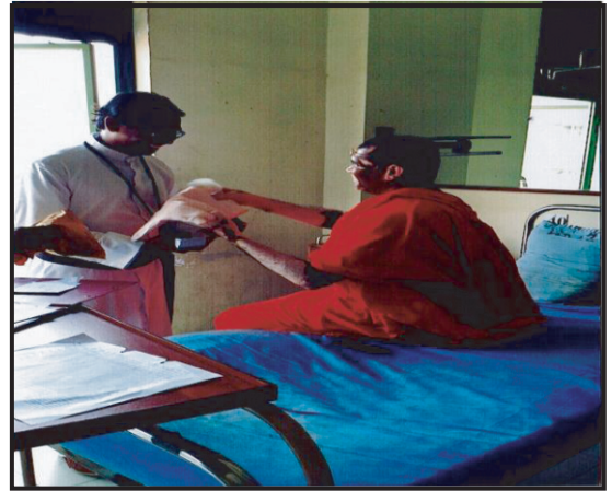
கொழும்பு மறை மாவட்டத்தின் அரசாங்க மருத்துவமனைகளில் நத்தார்