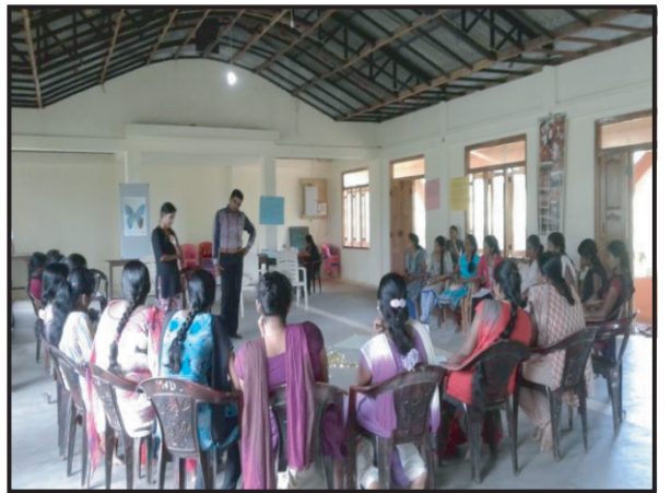
மட்டக்களப்பு மறை மாவட்டத்தின் ஆன்மீக அளுமை நிகழ்ச்சித்திட்டம்