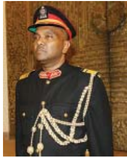
නරේන්ද්‍ර ප්‍රනාන්දු වේතුධාරී (2018 අගෝස්තු සිට මේ දක්වා)